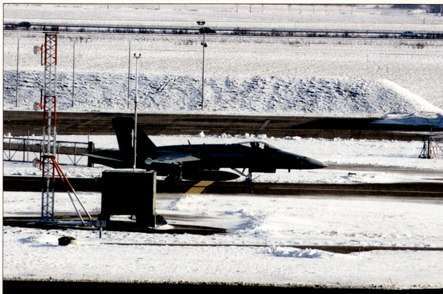
La base aérienne est la clé de voûte des opérations.

Par ailleurs selon les principes mêmes du concept, la BA doit pouvoir fonctionner et fournir les prestations exigées en toute situation. Donc la planification et la conduite des opérations devraient être semblables sinon identiques en toute circonstance, avec ou sans renforcement par la milice.