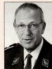
Walter Knutti, Brigadier, Chef Stab Luftwaffe, wird auf den 1. Januar 2006 zum Kdt Luftwaffe ernannt und zum Korpskommandanten befördert, 1595 Faoug.

Bis zu neuerlichen, weiteren Anpassungen wird es aber für die Luftwaffe vorab darum gehen, die neuen Strukturen zum Leben zu erwecken, dort wo prozessuale Schnitte ungünstig liegen, Feinkorrekturen vorzunehmen und dafür zu sorgen, dass die «neue» Luftwaffe eine grösstmögliche Handlungsfreiheit erhalten kann, die es ihr ermöglicht, weiterhin rasch und zuverlässig in höchster Qualität ihren Auftrag im Luftraum selbstständig und ohne künstliche oder unnötige Hindernisse zu Gunsten von Armee und Bevölkerung zu erfüllen. ■