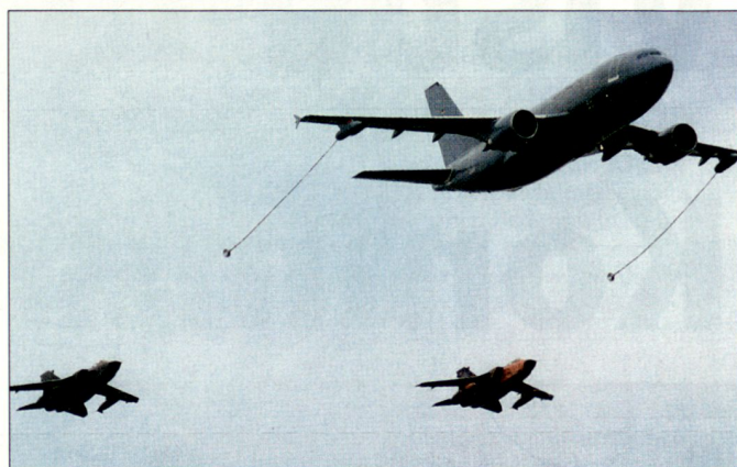
Auch die deutsche Bundeswehr schafft eigene Fähigkeiten zur Luftbetankung.

Mit der Verbindung von Langstreckentransport und Luftbetankung beschreitet die Deutsche