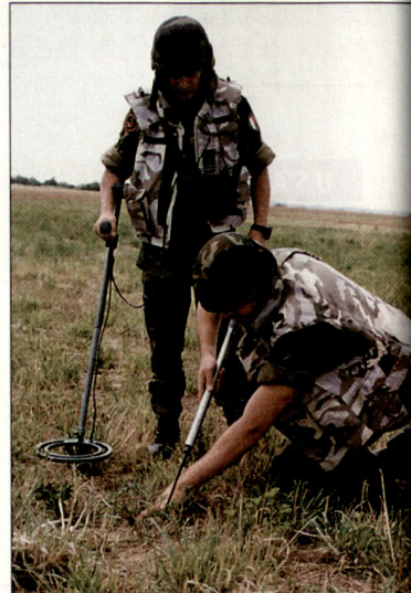
Die Minenräumung durch zivile und militärische Räumungsspezialisten kommt nur sehr langsam voran.

Die deutsche Bundesregierung unterstützt das Minenräumen in Afghanistan erneut mit einem Beitrag von 2,8 Mio. Euro. Seit 1995 hat die Bundesregierung gemäss eigener Angaben insgesamt 27 Mio. Euro für das humanitäre Minenräumen in Afghanistan eingesetzt. Unterdessen musste Anfang Juni 2005 einmal mehr das Minenräumen aus Sicherheits-