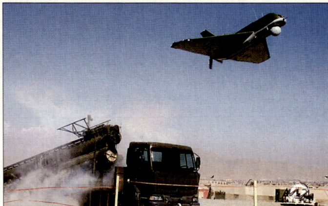
Bei der ISAF in Afghanistan stehen auch diverse Drohnensysteme im Einsatz. Im Bild das kanadische UAV «Sperwer».

Nach den fünf PRTs im Norden wird die NATO im Verlaufe dieses Jahres weitere vier Aufbautams im Westen Afghanistans übernehmen und dadurch den Verantwortungsbereich wesentlich ausdehnen. Im Frühjahr 2006 sollen mit der Umsetzung der Stufe 3 auch PRTs im Süden des Landes übernommen werden.