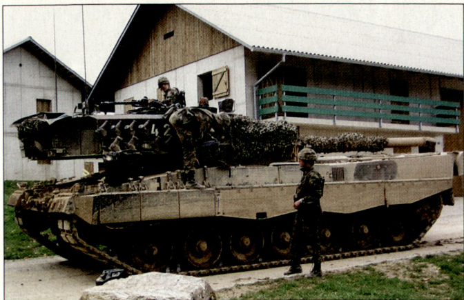
Ortskampfanlage Nalé eingenommen! Die Pz Gren Log Kp 20 liefert in der Gefechtspause Betriebsstoff für die Kampfpanzer.

In einer Bataillonsübung mit sämtlichen Mitteln wie Aufklärungsfahrzeugen, Kampfschützenpanzern, Kampfpanzern Leopard, Minenwerferpanzern, Entpannungspanzer, Radpanzern Piranha und den Gefechtsgrenadieren konnten die Angehörigen den Verband gesamthaft im Einsatz begutachten. Danach wurden im Nahkampfdorf kompanieweise die zahlreichen Metiers praktisch und theoretisch dargestellt bis hin zum gemütlichen Festbetrieb mit den Angehörigen – die Milizarmee wie sie lebt und lebt.