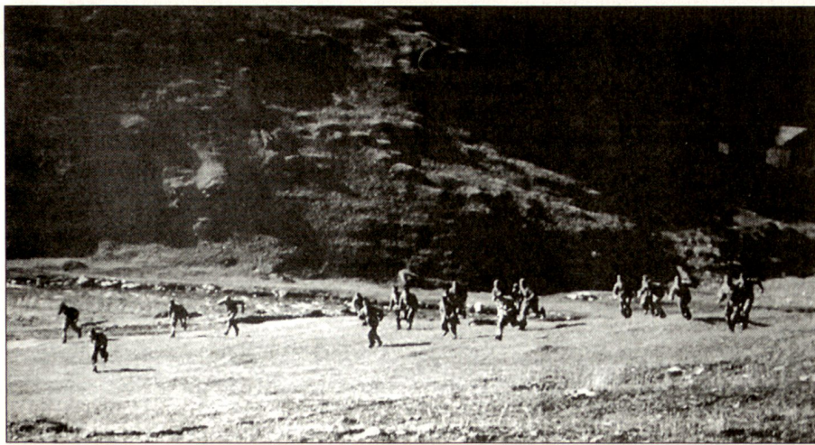
Polnische Internierte bei der Formationsschulung auf dem Valsenberg 1942.