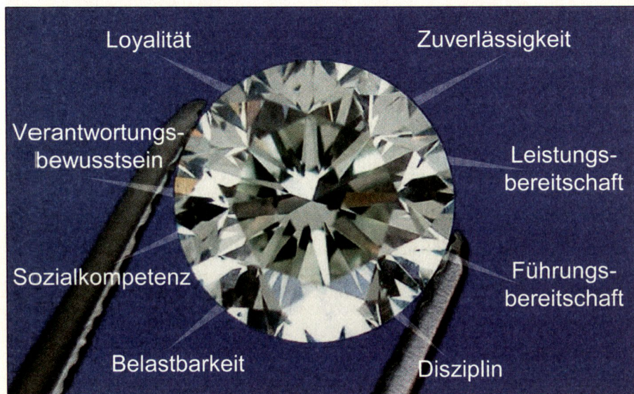
Für Führungskräfte der Armee und der Privatwirtschaft gelten die gleichen Erfolgswerte. Grafiken: Gsponer Consulting Group AG

oder der ideale Projektleiter/in sein! Sie haben solche Situationen ja bereits mehrmals erlebt und eingeübt! Es liegt alleine an Ihrem Verhalten und Ihrer Kommunikation, ob wir ihre Talente und Fähigkeiten, die sie in der militärischen Ausbildung