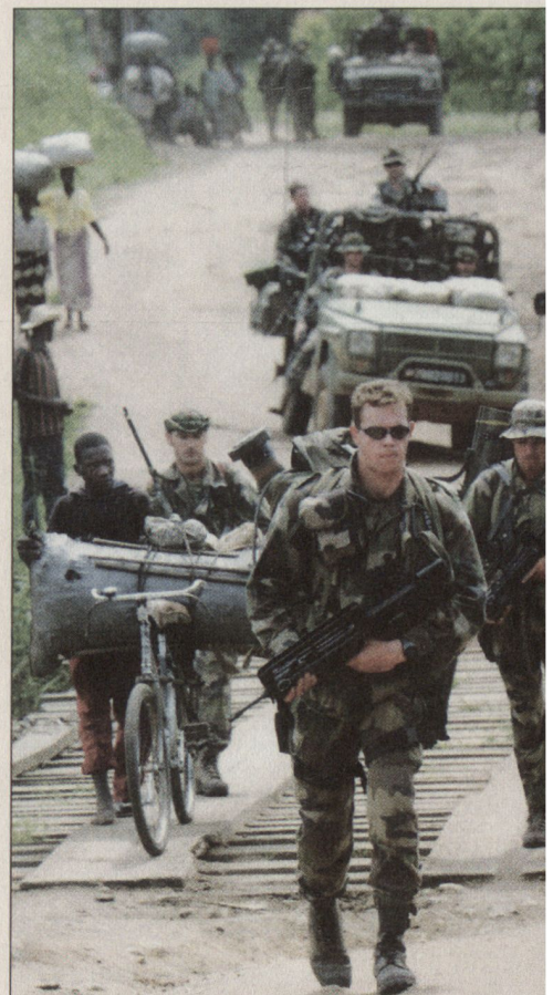
Aufklärungspatrouille in Bunia.

– Ein beachtlicher Erfolg der Operation war sicherlich die schnelle Entsendung der Truppen nach Bunia trotz komplexen logistischen Problemen und einem schwierigen sicherheitspolitischen Umfeld. Zu Beginn der Operation konnte der Flugplatz von Bunia nicht gebraucht werden, und die Truppen und Korpswaffen mussten deshalb über eine Fliegerbasis in Entebbe disloziert werden. Der Lufttransport wurde mit C-130- und C-160-Transportflugzeugen durchgeführt, die von Kanada, Belgien und Brasilien zur Verfügung gestellt wurden.