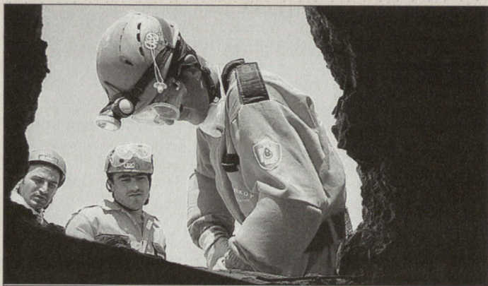
Ausbildung von ausländischen Rettungsorganisationen.

Leistungen für humanitäre Hilfeleistungen sind «Nebenprodukte» und basieren auf Ressourcen und Kompetenzen, die für andere Armeeaufträge benötigt werden. Speziell in den Bereichen Rettung, Genie, Lufttransport und friedensfördernden Operationen lassen sich hohe Synergiepotenziale ausschöpfen. In einem ersten Schritt werden in Zusammenarbeit mit den zivilen Partnern vorhandene Spezialisten und Truppenteile als Module für humanitäre Hilfeleistungen identifiziert. Zum Zweiten werden Massnahmen eingeleitet, um die hohe Bereitschaft (Einsatz innert Stunden) und eine spezifische Ausbildung sicherzustellen. Fallweise muss auslandtaugliches Zusatzmaterial beschafft werden. Nach einer Pilot- und Aufbauphase dürfte die Armee in wenigen Jahren über eine kleine Anzahl, hochspezialisierter Module (Überschwemmungen, Rettung, ABC usw.) für die Unterstützung humanitärer Hilfeleistungen verfügen. Mit relativ geringen Ressourcen kann die Armee die zivile humanitäre Hilfe der Schweiz wirkungsvoll unterstützen und einen kleinen Beitrag zur Linderung von Not und Elend nach Katastrophen und Krisen leisten. ■