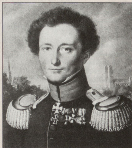
Carl von Clausewitz weilte mit Prinz August im Herbst 1807 längere Zeit auf Schloss Coppet am Genfer See (Schramm, a.a.O., S. 98).

In seinen späteren Aufzeichnungen hat er die militärische Bedeutung der Schweiz