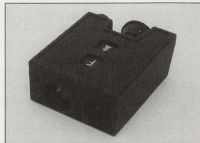
PLRF10 Pocket Laser Range Finder.

Auf Grund eines kürzlich unterzeichneten Vertrages zwischen armasuisse und Vectronix AG fertigt die Heerbruggen Firma 196 LEM 04 Laser-Entfernungsmesser für die Schweizer Armee. LEM 04 ist eine Variante des Pocket Laser Range Finders PLRF10 mit kundenspezifischer Software. Diese sowie Kompaktheit, minimales Gewicht und Erfüllung harter Umweltspezifikationen gemäss MIL-STD 810F waren entscheidende Kriterien in der Evaluation. www.vectronix.ch dk