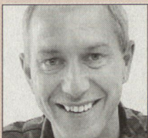
Oberst i GSt Daniel Schlup, Kommandant des ZIKA

«Wir verfügen über eine ausgezeichnete Ausbildungsinfrastruktur, die einer modernen Erwachsenenbildung umfassend gerecht wird.»