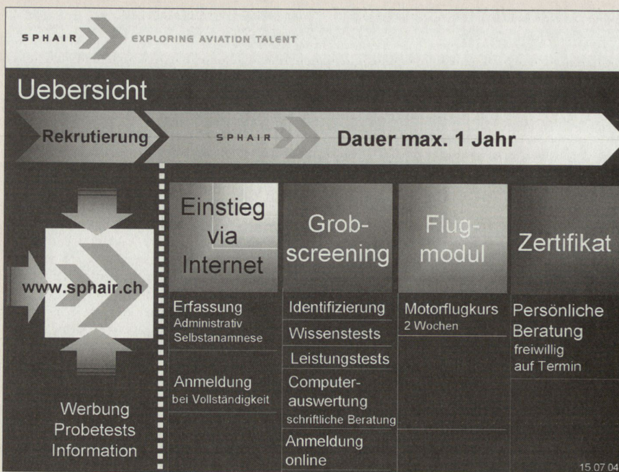
Schematische Darstellung des Ablaufes von SPHAIR.

Das Medium Internet, von jungen Leuten ohne Hemmschwelle benutzt, ermöglicht den einfachen und leichten Zugang zu Informationen über die Fliegerische Vorschulung. Damit werden die Interessierten nicht schon zu Beginn mit einer Verpflichtung (Erscheinen zur ärztlichen Voruntersuchung, Prüfung usw.) konfrontiert. Zusammen mit einem auf die ju-