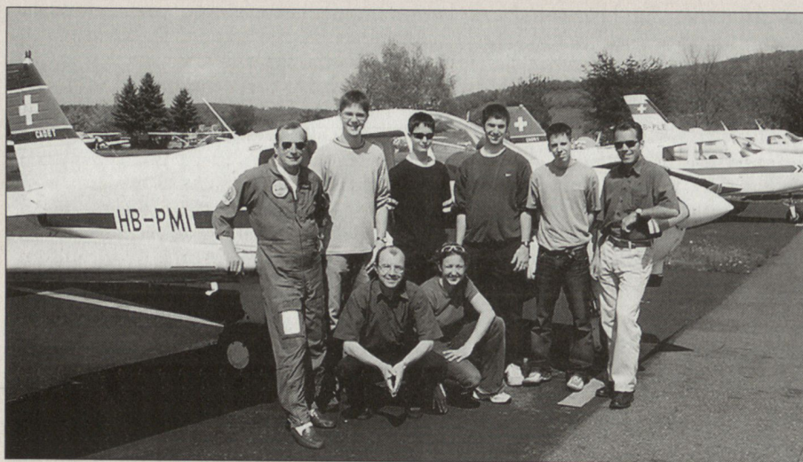
Fluglehrer und Teilnehmer eines der ersten SPHAIR-Kurse im April 2004 im Birrfeld.

halb fatal, auf Grund der aktuellen Situation Ausbildungsgefässe, wie z. B. die FVS, auslaufen zu lassen.