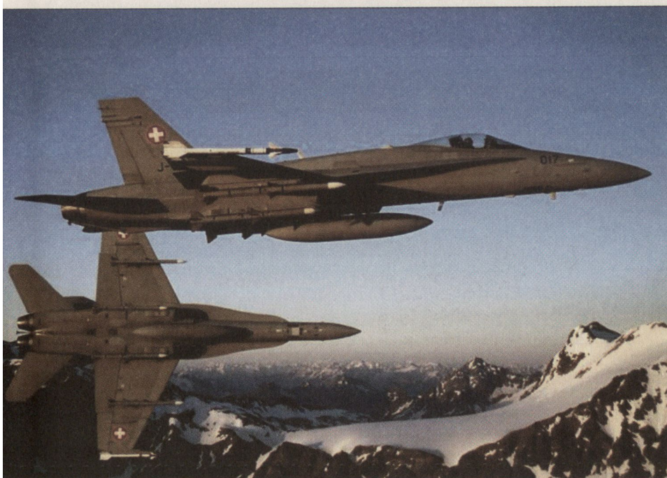
Ein harter und langer Ausbildungsweg bis ins Cockpit einer F/A-18.

Qualifizierte Piloten können aber bei entsprechender Nachfrage nicht einfach aus dem Hut gezaubert werden; deren Ausbildung ist zeitaufwändig, und die notwendige Berufserfahrung kann nicht einfach in Büchern angelesen werden. Es wäre des-