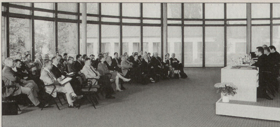
Die Veranstaltung zum Thema «Nation-Building» fand im neuen Zentrum des Lilienberg Unternehmerforums in Ermatingen/TG statt.