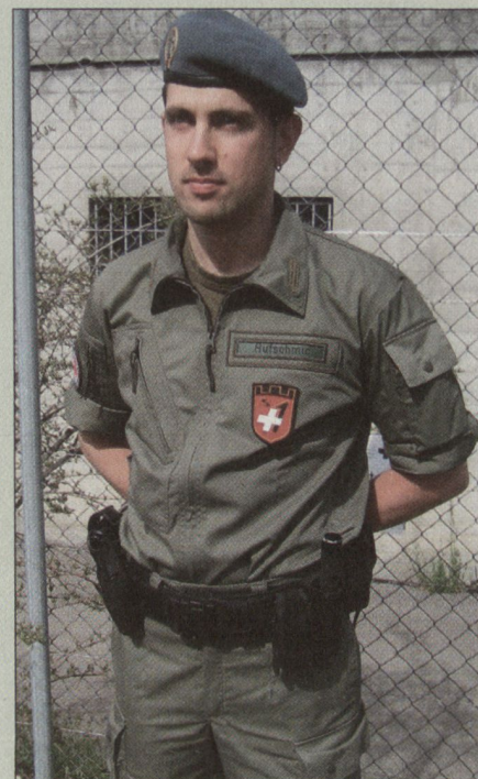
AdA Mil Sich im Tenue «olive».

Die dem Heer unterstellte Mil Sich arbeitet armeeseitig eng zusammen mit: Oberauditorat, PST A, FST A, Kdo Ausb