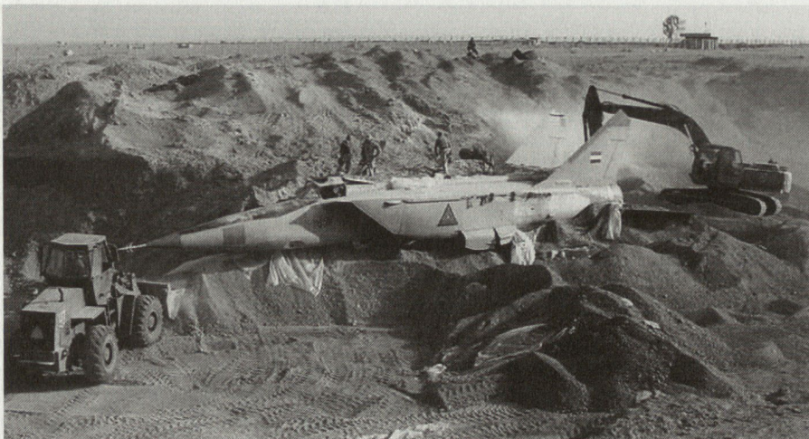
Beispiel einer kolossalen Fehlinvestition in den letzten Jahren: Die irakische Luftwaffe vergrub sich im Sand, Anzahl Einsätze während OIF = 0.