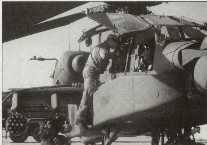
Vorbereitung niederländischer Kampfhelikopter «Apache» für den Einsatz in Afghanistan.

Weiterhin stark vertreten mit militärischen Kräften ist Frankreich in Afrika. Gegenwärtig befinden sich grössere Kontingente französischer Truppen in Gabun, Elfenbeinküste, Tschad, Senegal, Kongo und Djibouti. hg