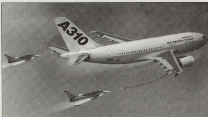
Der A-310 MRTT der deutschen Luftwaffe ist für die Luftbetankung von «Eurofighter» und «Tornado» vorgesehen.

Die hohe Mobilität des «Mungo» wird durch das «Multicar»-Fahrgestell mit Allradantrieb, Differenzialsperrern, elektronische Traktionskontrolle, Antiblockiersystem, Notlaufreifen und Kriechgang vor allem im schwierigen Gelände sichergestellt. Durch die enorme Leistungsdichte der in dieser Fahrzeugklasse einmaligen Gesamtnutzlast von 3,5 t kann die Forderung nach grösstmöglichem Schutz auch beim Einsatz in Krisenregionen optimal erfüllt werden. hg