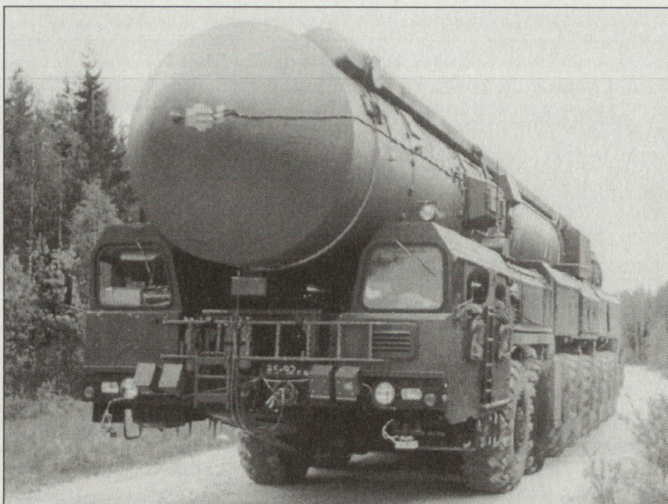
Prototyp der mobilen Version der neuen ICBM «Topol-M».

■ Durchführung von Kontrollflügen mit Helikoptern in der Umgebung von An- und Abflugschneisen der Flugplätze. hg