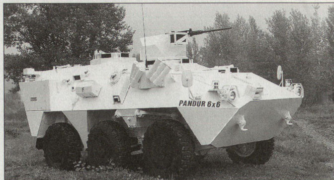
Prototyp des modernisierten Radschützenpanzers «Pandur» (6x6).