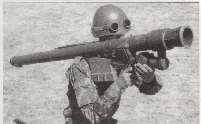
Russische Ein-Mann-Flab-Lenk Waffe SA-18 «Igla».