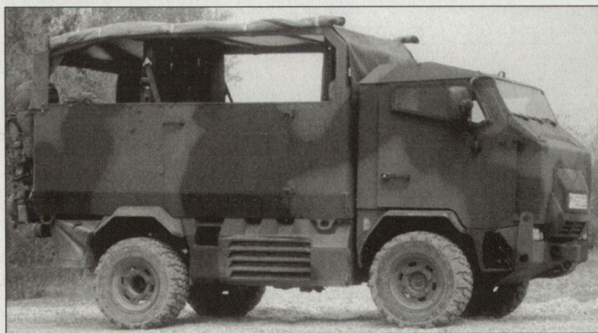
Die deutsche Bundeswehr will künftig vor allem Transportfahrzeuge mit verbessertem Schutz beschaffen.

Absehbar ist, dass in den nächsten Jahren auch weitere NATO-Luftstreitkräfte Luftbetankungsflugzeuge dieses Typs beschaffen werden. Kanada hat unterdessen zwei dieser Flugzeuge bestellt. hg