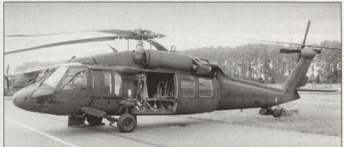
Transporthelikopter UH-60 «Black Hawk» bei der US Army.

Vorgesehen ist, dass die Produktion aller wesentlichen Komponenten sowie auch die Endmontage für die Helikopter UH-60 «Black Hawk» (internationale Exportbezeichnung S-70) in der Türkei vorgenommen wird. Dabei ist mit einer jährlichen Produktion von 20 bis 40 Helikoptern zu rechnen, die vor allem für den weltweiten Export vorgesehen sind. Die türkischen Streitkräfte verfügen heute über rund 50 Helikopter «Black Hawk» der Version S-70A. Vorgesehen ist ein Bestand von 100 Maschinen dieses Typs. Der «Black Hawk» wird heute weltweit in diversen Armeen genutzt. In Europa verfügen nebst der Türkei auch Griechenland und Österreich über Helikopter dieses Typs. hg