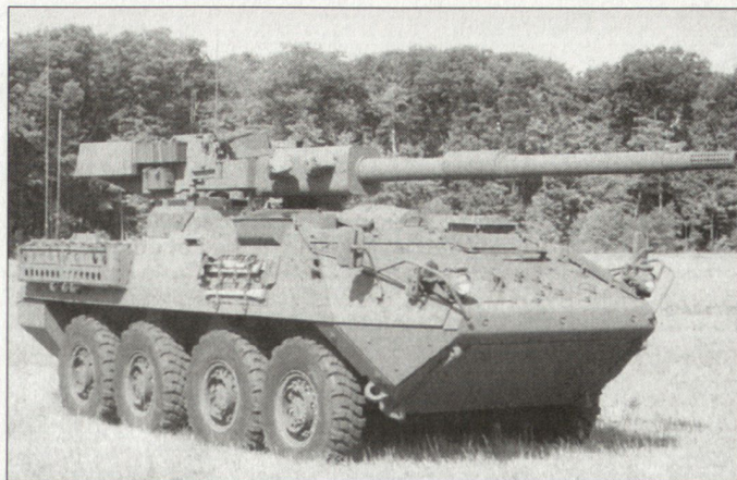
Radpanzer «Stryker» in der Version «Mobile Gun System».

ren insgesamt sechs «Stryker»-Bridgen aufgestellt werden (siehe auch ASMZ 9/2003, Seite 41). Beim Kampffahrzeug «Stryker» handelt es sich um eine Weiterentwicklung des Radschützenpanzers «Piranha III». Insgesamt ist für die US Army eine Beschaffung von gegen 2100 Fahrzeugen in diversen Versionen geplant. Für die kanadischen Streitkräfte ist diese Ablösung von Kampfpanzern durch eine neue leichtere Kampffahrzeugkategorie ein erster Schritt in Richtung Armee der Zukunft. Auch im kanadischen Heer soll das Gros der heutigen mechanisierten Verbände durch leichtere und beweglichere Einheiten ersetzt werden. Gleichzeitig soll auch die Nutzung moderner Sensor- und Kommunikationstechnik vorangetrieben und die Fähigkeit zu netzwerkzentrierten Operationen schrittweise realisiert werden. hg