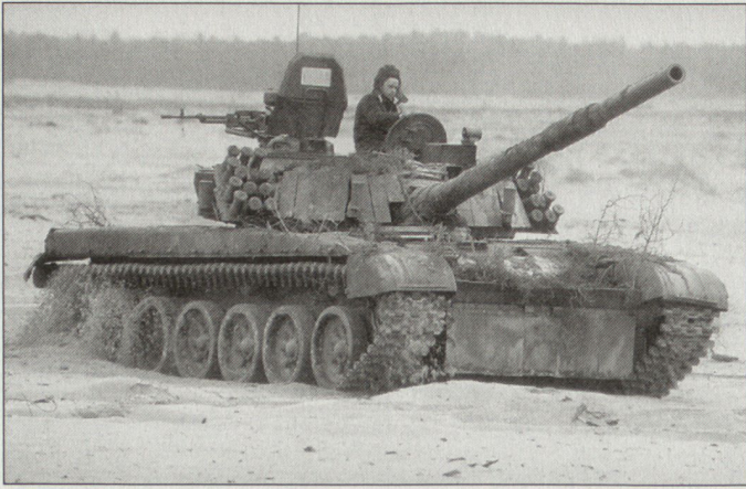
Die polnische Armee verfügt noch über eine grosse Anzahl von Kampfpanzern T-72; nur ein kleiner Teil davon soll NATO-kompatibel gemacht werden.

600 T-72M1. Insbesondere die PT-91 sind noch relativ neu und verfügen über Leistungsreserven. Mit der Einführung der «Leopard 2A4» konnte nebst einer unmittelbaren Leistungssteigerung bei der Panzertruppe auch eine rasche Kompatibilität zu analogen NATO-Kräften erreicht werden. Andererseits muss mit dieser Einführung auch der Aufbau einer zweiten logistischen Basis in Kauf genommen werden. Geplant ist im Weiteren, dass in den nächsten Jahren ein Teil der östlichen Panzer auf das westliche Kaliber 120 mm umgerüstet werden soll. Vorgesehen ist der Einbau der deutschen Kanone L44 mit dem entsprechenden Munitionszuführungs-