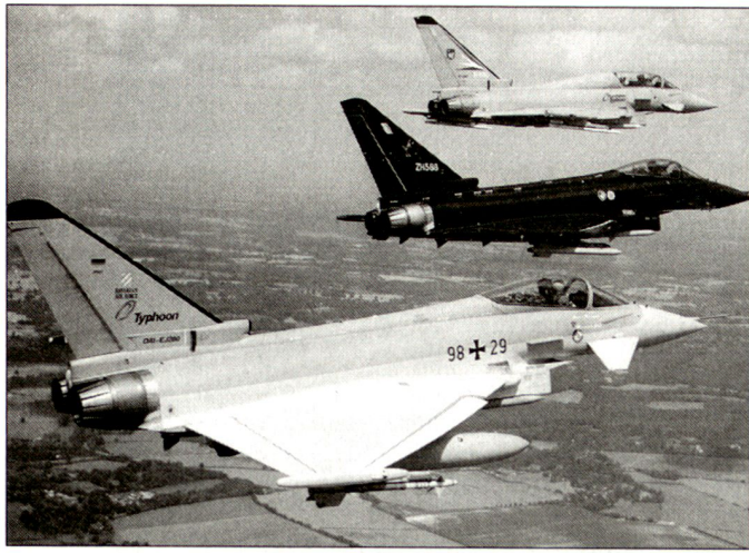
Prototypen des neuen Kampfflugzeuges «Eurofighter».

wendigkeit dieser hohen Stückzahl geliefert hätte.