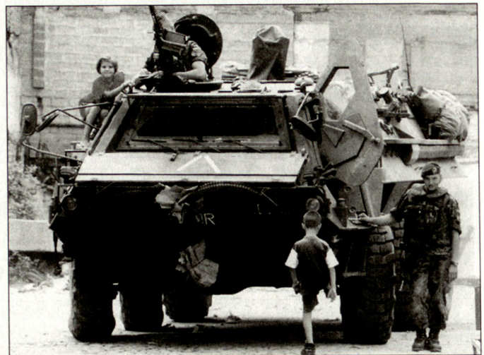
Abschied vom Verteidigungsauftrag und Konzentration auf die neuen Aufgaben (Bild: Deutscher Schützenpanzer «Fuchs» bei der KFOR).

rungen für den Verteidigungsfall einschliesslich der Mobilmachungsfähigkeit würden nicht mehr benötigt. Personal und Finanzen, die durch die beabsichtigte Neuausrichtung freigestellt werden können, sollen unmittelbar in andere Aufgabenbereiche eingesetzt werden. Dies entspreche auch den Beschlüssen des Prager NATO-Gipfels, bei dem das Bündnis nicht zuletzt auf Druck der USA auf die neuen Bedrohungen eingestellt wurde. Der Verteidigungsminister gestand ein, dass eine veränderte Aufgabenstellung die Fragen nach der Verfassungsmässigkeit der Reform und ihre Vereinbarkeit mit dem Artikel 87a des Grundgesetzes rechtfertige. Die Neuausrichtung der Bundeswehr soll ihren Niederschlag in den neuen verteidigungspolitischen Richtlinien finden, dem so genannten Grundlagendokument für den Aufbau der Bundeswehr, das letztlich nach der Wiedervereinigung neu for-