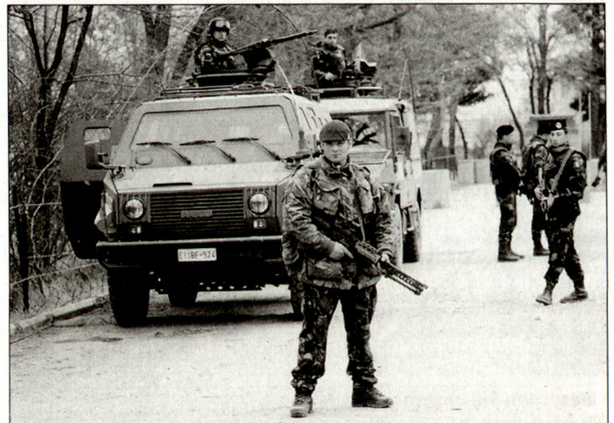
Angehörige des italienischen Kontingents bei der ISAF in Afghanistan.

Die italienische Task Force soll vorerst für sechs Monate im Einsatz verbleiben; dieser erfolgt zusätzlich zu den rund 440 italienischen Soldaten, die derzeit bei ISAF (International Security Assistant Force) eingesetzt sind. Gemäss Aussagen des Verteidigungsministers Martino handelt es sich hier um keine überraschende Aktion, sondern um eine logische Fortsetzung der italienischen Bestrebungen zur Unterstützung der globalen Terrorismusbekämpfung. Das entsprechende Angebot sei