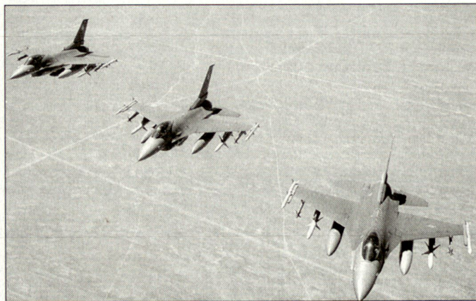
Hohe Belastung für die weltweit im Einsatz stehenden Besatzungen amerikanischer Kampfflugzeuge.

Einsatzkräfte der US Air Force (USAF) in zehn AEFs eingeteilt. Jeweils zwei von ihnen stehen während drei Monaten jederzeit für Einsätze auf Abruf bereit. Die AEF sind nach dem Baukastenprinzip zusammengestellt: Führungselement jeder AEF ist ein Jagd-, Jagdbomber- oder Bombergeschwader. Hinzu kommt ein Transport-/Tankergeschwader. Zu den AEFs gehören auch die jeweiligen nichtkämpfenden Einheiten, die zur Unterstützung der Einsatztruppen dienen. Das Kern-Ein-