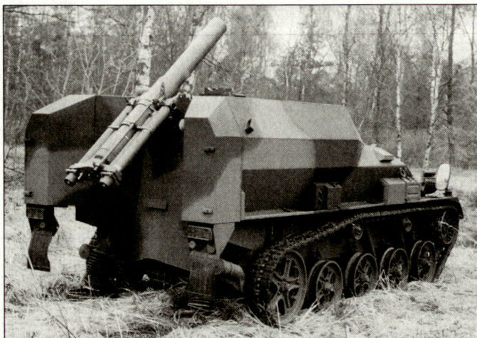
Modell des neuen mobilen Panzerminenwerfers «Wiesel 2».

Nach der für Anfang 2004 geplanten Auslieferung der beiden Erprobungssysteme wird der LePzMrs 120 mm «Wiesel 2» in die Truppenerprobung gehen; eine Serienbeschaffung kommt frühestens ab 2006 in Frage. hg