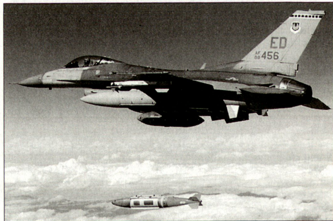
Abwurf einer JDAM ab Kampfflugzeug F-16.

Einsatzrechner, eine Trägheitseinheit, einen GPS-Empfänger und batteriegetriebene Aktuatoren zum Bewegen der Lenkflossen. An den Bomben werden zudem so genannte Strakes angebracht, um die aerodynamische Stabilität zu erhöhen. Der als dringend bezeichnete Auftrag für diese 18840 JDAM-Sätze ist von Boeing bis zum März 2004 zu erfüllen. Dazu wird das Unternehmen seine Produktionsstätte in St. Charles, Montana, ausweiten, um ab August 2003 auf eine monatliche Produktion von mindestens 2800 Lenksätze zu kommen. Die Verwendung von JDAM-gelenkten Bomben wird auch bei einem Militäreinsatz gegen den Irak von Bedeutung sein. hg