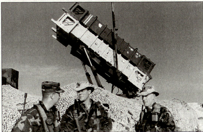
Einsatz von «Patriot»-Systemen während des Golfkrieges 1991; die Abwehrfähigkeit gegen SCUD-Raketen war damals noch ungenügend.

PAC-3» soll in einem regionalen Konflikt zur Abwehr von Flieger- und Raketenangriffen in mittleren und grossen Höhen eingesetzt werden. Die mehr als fünf Meter langen Lenkflugkörper erreichen fast vierfache Schallgeschwindigkeit und können Ziele bis maximal 30 km Höhe bekämpfen; die maximale Einsatzreichweite beträgt zirka 100 km. Wie die Vorgängersysteme wird auch «Patriot PAC-3» stationär eingesetzt; ein Stellungsbezug dauert rund 40 Minuten. Das komplette System kann mit schweren Transportflugzeugen der Typen C-5 «Galaxy»