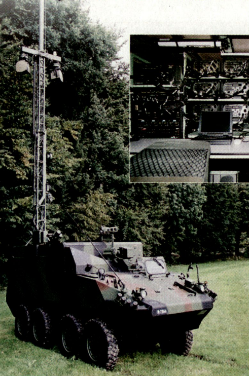
MOWAG PIRANHA IIIC 8x8 RAP Pz mit ausgefahrenem 10-m-Teleskopmast. Gut sichtbar die beiden Richtfunkgeräte sowie die VHF-Stabantenne.