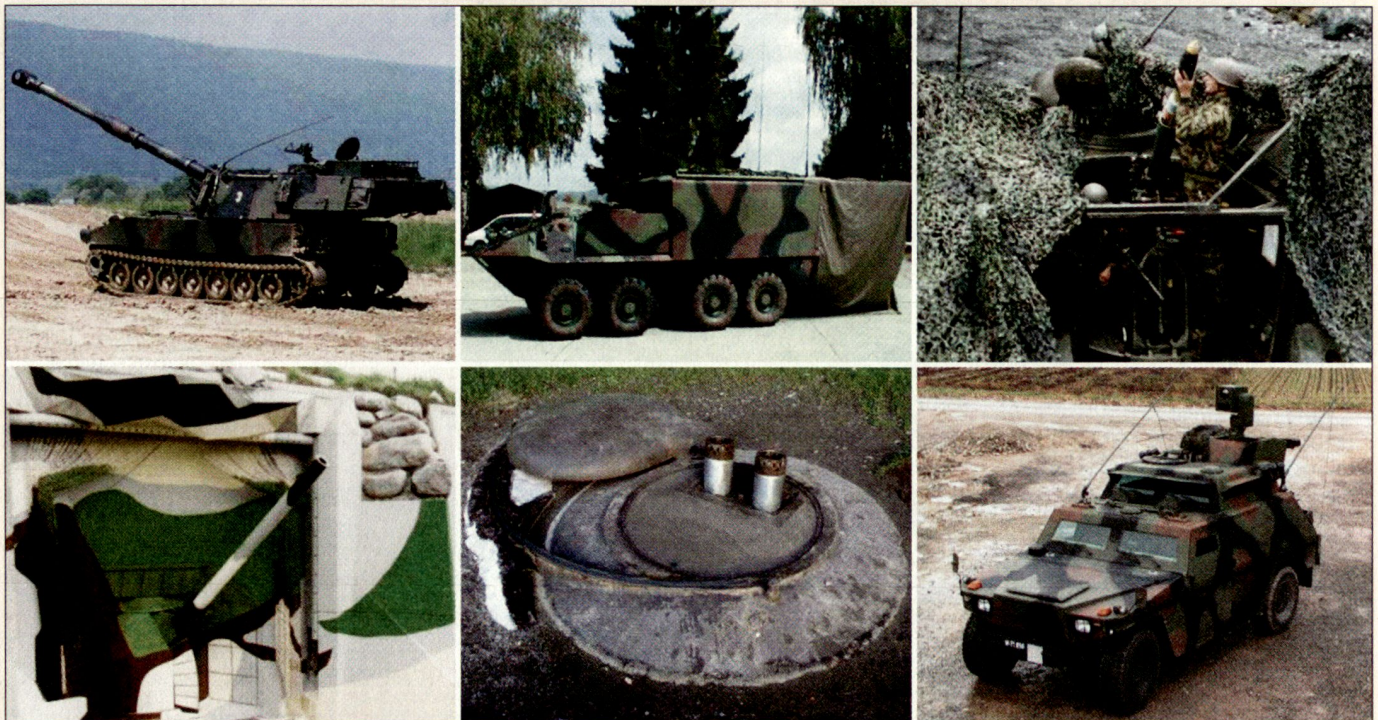
Wichtige Systeme im Lehrverband Artillerie: Kampfwertgesteigerte Panzerhaubitze M-109, Führungsfahrzeug Piranha IIC, Panzerminenwerfer M-113, Festungskanone BISON, Festungsminenwerfer und Schiesskommandantenfahrzeug (v. l. n. r.).

Grundsätzlich geht es um die Sicherstellung der Ausbildung der taktischen Einheit in der Grundausbildung und um das Erstellen bzw. um das Überprüfen der Grundbereitschaft der Abteilungen und Einheiten. Was bezüglich artilleristischem Können in der A 61 erreicht und in der A 95 leider verloren ging, muss mit der neuen Armee wieder erarbeitet werden. Für eine glaubhafte und sichere Feuerunterstützung dürfen wir uns in der Ausbildung und Führung keine Halbheiten erlauben. Dabei sind aber auch die Miliz und vorab die Kader gefordert.