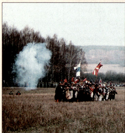
Die Rekonstruktion der Schlacht in vollem Gange. Links unterstützt die Artillerie den Truppenaufmarsch. Im Hintergrund rechts stossen Verstärkungen über die Beresina.