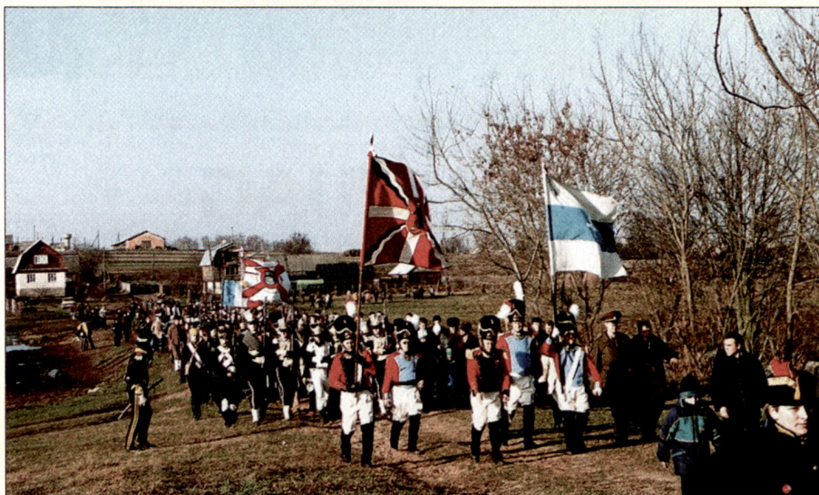
Aufmarsch der Truppen zur Rekonstruktion der Schlacht an der Beresina, im Vordergrund die Fahnen der Beresinagrenadiere des 3. und 4. Regiments der Glarner und Zuger.