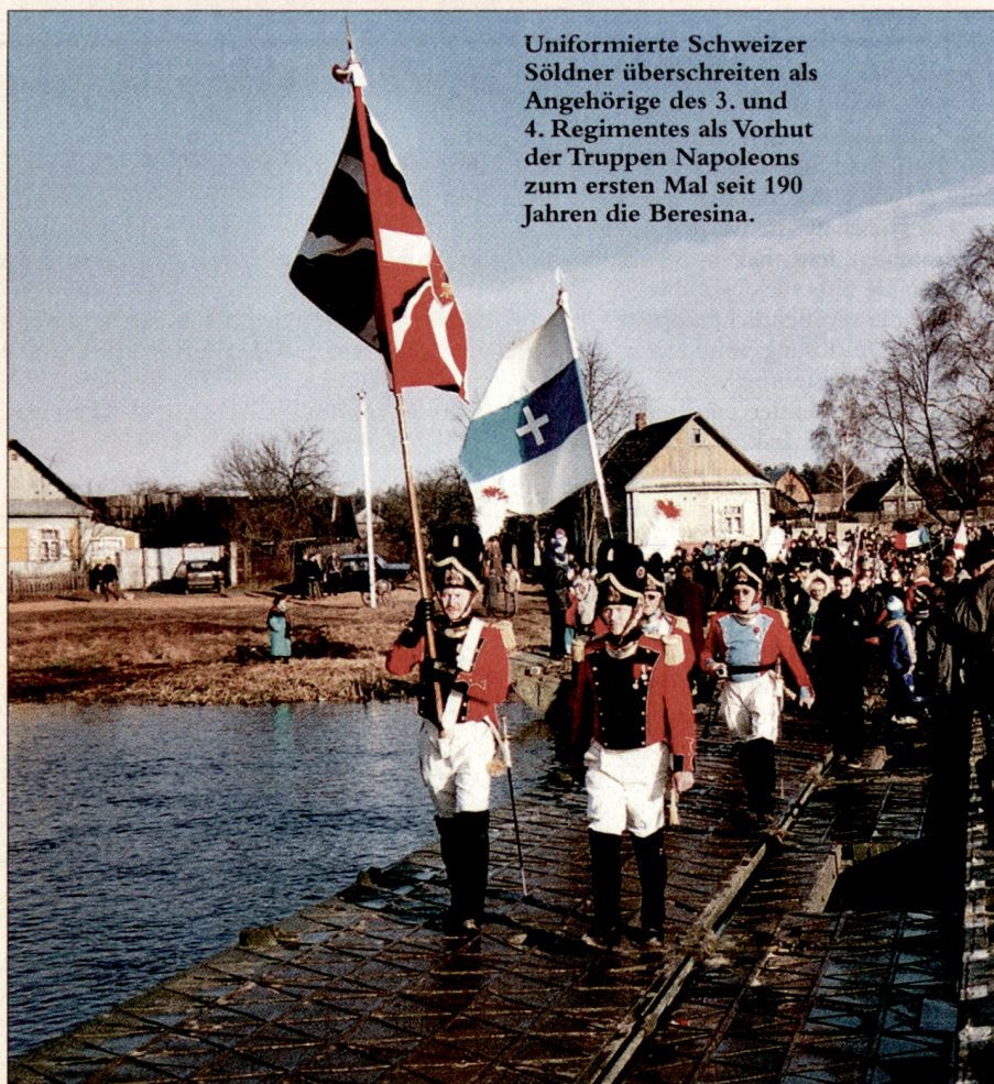
Uniformierte Schweizer Söldner überschreiten als Angehörige des 3. und 4. Regiments als Vorhut der Truppen Napoleons zum ersten Mal seit 190 Jahren die Beresina.

Oberhalb von Borisov, beim Dorf Studjanka, gestattete eine Furt von zirka 1,5 m Tiefe trotz grosser Kälte und Eisschollen den Bau von Bockbrücken. Als Baumaterial dienten Holzbalken von in der Umgebung abgebrochenen Häusern. Am 26. November 1812, um 13 Uhr, war die erste der beiden Brücken fertig. Das II. Armeekorps, das neben den Schweizern auch Polen, Kroaten und Franzosen umfasste, überquerte sogleich den Fluss, um auf der gegenüberliegenden Seite einen Brückenkopf zu bilden und zu halten. Die erfolgreiche Verteidigung gegen eine starke Übermacht ist die grosse militärische Leistung an der Beresina. Kurz vor dem Hauptkampf vom 28. November stimmte noch Leutnant Legler sein Lieblingslied an, welches fortan das Beresinalied genannt wird: Unser Leben gleicht der Reise – eines Wandrers in der Nacht usw. Infolge Munitionsmangels der Verteidiger rückten