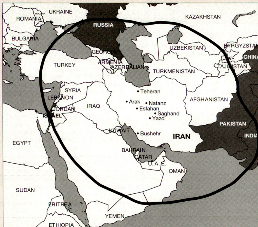
Der Iran und seine wichtigsten Nuklearanlagen. Die Kurve umrandet das Gebiet, welches mit einer iranischen Rakete von 1000 km Reichweite getroffen werden könnte. Dunkel sind die Staaten mit Nuklearwaffen dargestellt.

abgeschlossen. 1976 folgte ein Vertrag mit der Deutschen «Kraftwerk Union» zum Bau von zwei 1300-MWe-Reaktoren in Bushehr. 1977 kam ein Vertrag mit Frankreich zum Bau von zwei Reaktoren in der Nähe von Ahvaz zustande. Iran bekundete ebenfalls Interesse an der Urananreicherung sowie an der Wiederaufbereitung von Brennstäben.