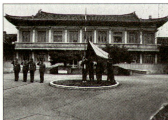
MG Klocok und seine Delegation verlassen Panmunjom mit der tschechoslowakischen Fahne, 3. April 1993 65