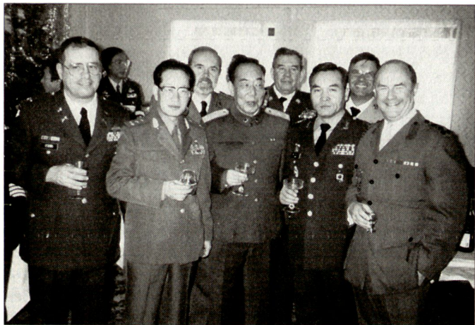
Was die NNSC tun kann: «To bring together» von links nach rechts: Amerikaner, Nordkoreaner, Schweizer, Chineser, Pole, Südkoreaner, Franzose und Brite. Offiziere zusammen in der JSA in Panmunjom anlässlich der Weihnachtsfeier 1991* 61