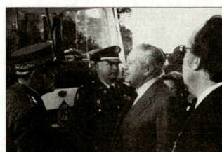
Besuch des portugiesischen Ministerpräsidenten Mario Soares in der JSA, April 1991 67

die KPA heftig: sie boykottierte die MAC und warf der NNSC vor, ihren Standpunkt nicht verteidigt zu haben. Angesichts dieser ansteigenden Spannung verfassten die 4 Mitglieder der NNSC ein an beide Seiten der MAC adressiertes Schreiben, in dem diese ersucht wurden, ernsthaft die Konsequenzen zu bedenken, die jegliche Veränderung innerhalb des Waffenstillstandsmechanismus haben könnte. Am 3. Juni 1991 wurden die Botschafter Polens und der Tschechoslowakei ins Aussenministerium in Pyongyang zitiert, um zu erfahren, dass die Anwesenheit ihrer Länder in der NNSC nicht mehr gerechtfertigt sei. Obwohl die NNSC keineswegs an der Auseinandersetzung zwischen der IAEA und der DPRK und noch weniger an der Anerkennung der Republik Korea durch die UdSSR und China beteiligt war, erfuhr die Stimmung, was leicht verständlich ist, keine Verbesserung. Ich betrachte dies als Beweis dafür, dass sich die Situation unserer polnischen und tschechoslowakischen Kollegen verschlechterte. Für die Letzteren bot die Teilung ihres Landes zu Beginn des Jahres 1993 der KPA die Gelegenheit, sie zurückzuschicken. Vertreter der Aussenministerien der vier neutralen Staaten der NNSC hatten in Prag eine Lösung gefunden, indem die Tschechische Republik die Verpflichtungen des ehemaligen Staates Tschechoslowakei übernommen hätte, jedoch meinten die Nordkoreaner, sie wären einzig befugt, ihre Partner innerhalb der NNSC auszuwählen.