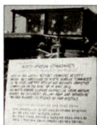
A gauche: Photo de la situation après l'attaque de 14. avril 1968 52 ; à droite: «UNC vehicle ambushed by North Korean communists, 14.4.1968» 53 (Texte à la page 42)

SEOUL (UNC)—North Korean Communists late Sunday ambushed and killed four United Nations Command soldiers, two American and two Korean, and wounded two others 800 yards south of the Joint Security Area at Panmunjom. UNC officials said the soldiers from the U.S. 2nd Inf. Div. were aboard a truck, with lights on, mak-