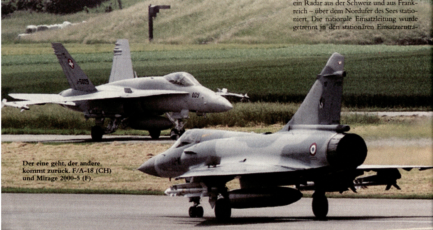
Der eine geht, der andere kommt zurück. F/A-18 (CH) und Mirage 2000-5 (F).

Zwingend war eine gemeinsame Einsatzleitung ab gleichem Ort. Die Wahl fiel auf ein «Deployable Combined Air Operation Center» (DCAOC) mit Standort Evian. Alle Sensoren, unter anderem boden- und luftgestützte Radars, wurden im DCAOC zusammengefasst. Zur Ausleuchtung des Genfersees und des Unterwallis wurden zwei mobile Radarstationen – je ein Radar aus der Schweiz und aus Frankreich – über dem Nordufer des Sees stationiert. Die nationale Einsatzleitung wurde getrennt in den stationären Einsatzzentra-