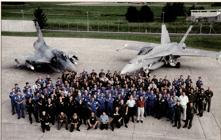
Gelebte Kooperation. Die schweizerische und französische Crew vor ihren Flugzeugen.

Die Disziplin der Privat- und Berufspiloten war sehr gut und das Verständnis für die anspruchsvolle und verantwortungsvolle Aufgabe der schweizerischen und der französischen Luftwaffe gross. Die hervorragende Kooperation auf den Zivilflugplätzen liess sogar einen Segelfluggbetrieb ab Montricher während dem Wochenende des G8 zu.