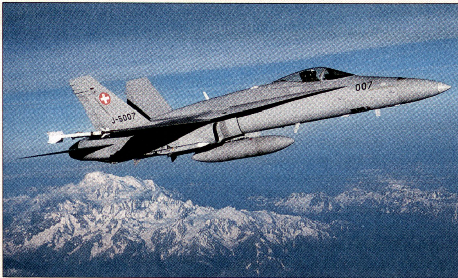
Mit «scharfer» Munition im Einsatz. Der F/A-18E mit Sidewinder (Flügelende) und AMRAAM (unter dem Flügel).

len der schweizerischen und der französischen Luftwaffe wahrgenommen.