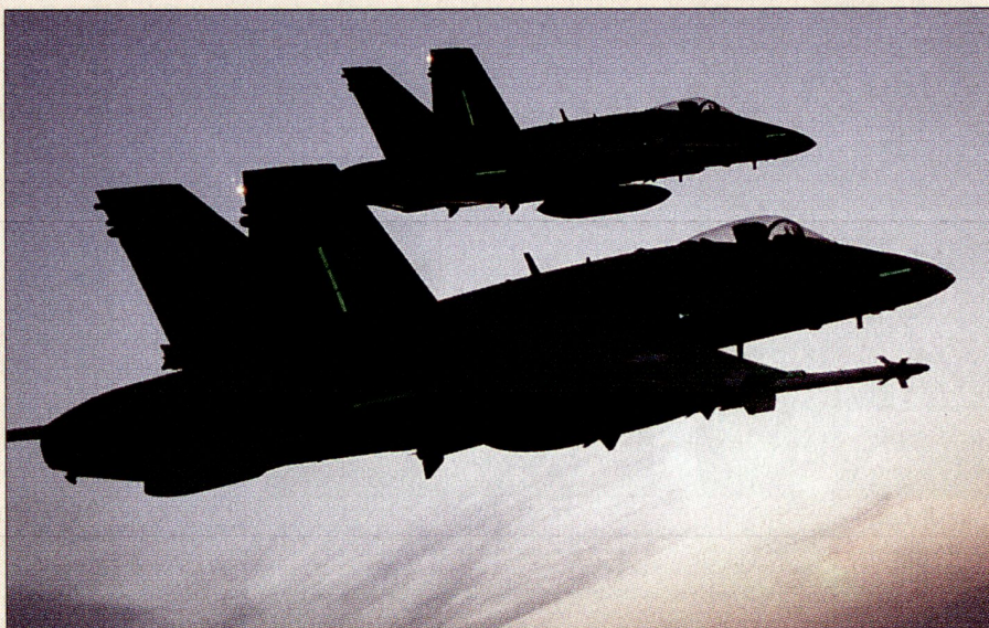
Zwei F/A-18E im Gegenlicht. Gut sichtbar die fluoreszierenden Streifen am Rumpf und Seitenrudern. Diese dienen als Markpunkte beim Dämmerungs- und Nachtpatrouillenflug.

Ab Dienstagmorgen, 22. Januar 2003 standen auf der Airbase Payerne rund um die Uhr F/A-18 bereit zum Einsatz. Während der Nacht sassen die Piloten im Ein-Stunden-Rhythmus im Cockpit angeschnallt bereit, um spätestens innert zwei Minuten nach Alarmauslösung durch die EZ starten zu können. Zwischen Morgen- und Abenddämmerung patrouillierten per-