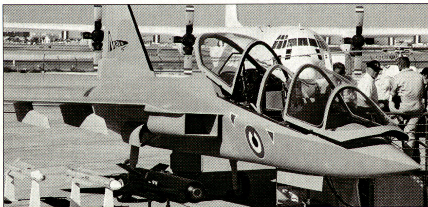
Mako HEAT von EADS.

■ Jet-Schulflugzeug: Hier zeichnet sich eine interessante Entwicklung ab. In den nächsten 15 Jahren wird die Ausbildung der Jet-Piloten in vielen europäischen Ländern neu gestaltet. Verschiedene Anbieter präsentierten ihre Konzepte. Aufsehen erregte die von EADS (European Aeronautic Defence and Space Company) ausgestellte Maquette «Mako HEAT» (High Energy Advanced Trainer). Die Flugeigenschaften sollen denen eines Kampffjets sehr ähnlich sein. Mako HEAT ist ein einstrahliges Hochleistungs-