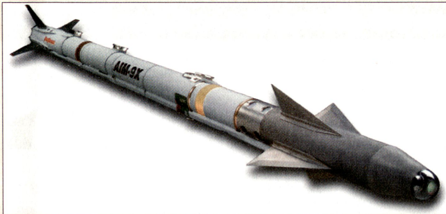
Kurzstreckenlenkwaffe Sidewinder AIM-9X.