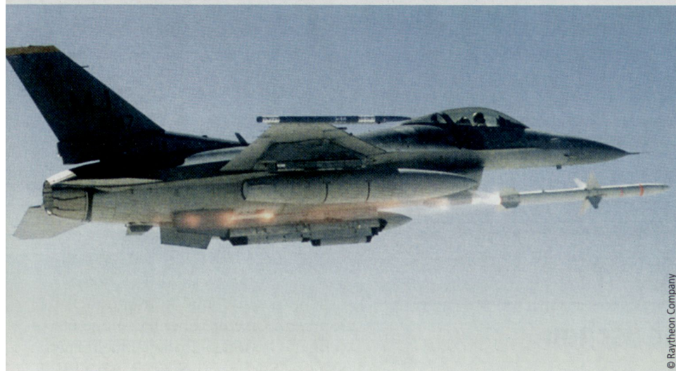
F-16 schießt AGM-88, HARM, ab.