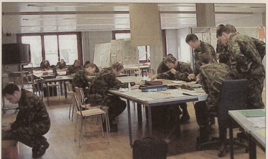
Der Führungssimulator 95 ist von der Ausbildung unserer Stäbe Stufe Bataillon bis Brigade nicht mehr wegzudenken.

■ Ausbau der Übungsinfrastruktur für mehr Direktunterstelle (modularer Brigadetyt XXI),