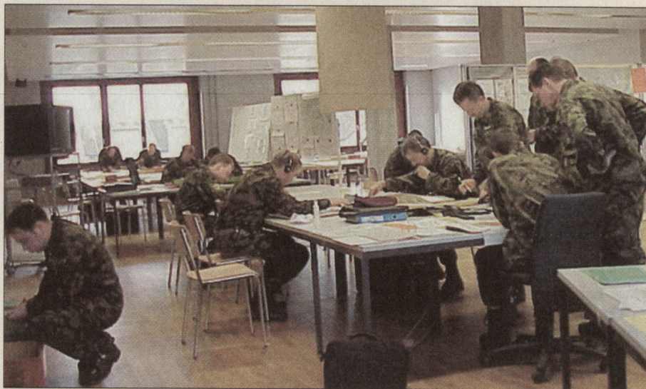
Der Führungssimulator 95 ist von der Ausbildung unserer Stäbe Stufe Bataillon bis Brigade nicht mehr wegzudenken.

■ Ausbau der Übungsinfrastruktur für mehr Direktunterstellte (modularer Brigadety XXI),