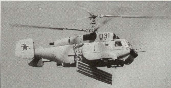
Produkte der russischen Luftfahrtindustrie: Überwachungshelikopter Ka-31.

Dominierende russische Firma im Kampfflugzeugbereich ist heute Suchoi. Es scheint, dass dieser Hersteller den langjährigen Konkurrenzkampf gegenüber den MiG-Werken zu seinen Gunsten entschieden hat. Neben zahlreichen anderen Typen nahmen von Suchoi die bekannten Prototypen an den Flugvorführungen teil, z.B. die S-37 «Berkut», die nunmehr unter der Bezeichnung Su-47 geführt wird. Vorgeführt wurde auch der dritte Prototyp des Zweisitzers Su-30MKI in der Version, wie sie nun an Indien geliefert werden soll. Dazu kam zum ersten Mal die Su-35UB, ebenfalls ein Doppelsitzer, der sich noch im Prototypenstadium befindet. Der Hersteller MiG beschränkte sich vor allem auf die Präsentation von kampfwertgesteigerten Maschinen der MiG-29-Serie sowie auf das