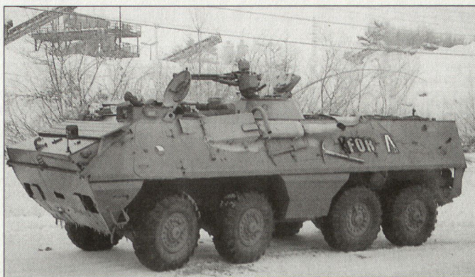
Schützenpanzer OT-64 des tschechischen KFOR-Kontingents.

Die tschechische Armee wollte sich ursprünglich aus dem Kosovo (KFOR) zurückziehen, um sich verstärkt auf die SFOR in Bosnien-Herzegowina konzentrieren zu können. Es scheint, dass diese Absicht von der NATO nicht akzeptiert worden ist und der NATO-Partner Tschechien angewiesen worden ist, sich noch ver-