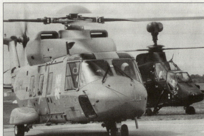
Produkte der europäischen Luftfahrtindustrie: Transporthelikopter NH-90 (links) und Kampfhelikopter «Tiger» (rechts).

Damit wird in Europa auch im Bereich der Transporthelikopter ein Zeichen für mehr Standardisierung gesetzt. hg