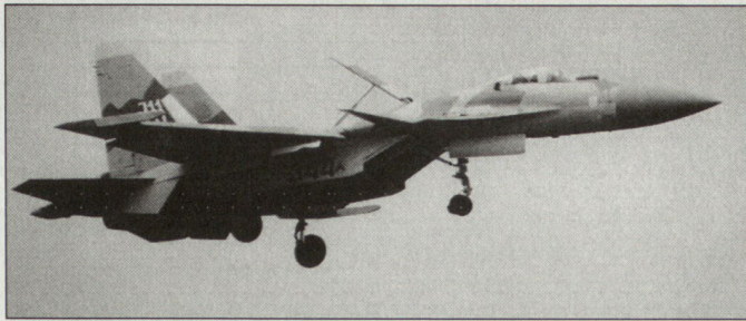
Kampfflugzeug Su-47 «Berkut».

Schul- resp. leichte Kampfflugzeug MiG-AT.