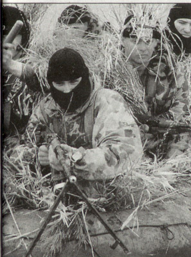
Soldaten der polnischen Spezialeinheit «Grom».

Bisher rekrutierten sich die Bestände der «Grom» hauptsächlich aus den polnischen Streitkräften, d.h. vornehmlich aus den Luftlandeverbänden. Künftig will man die Rekrutierungsmöglichkeiten erweitern. Einen Schwachpunkt bilden bisher die eingeschränkten Lufttransportmöglichkeiten, wie sie bei Spezialtruppen moderner Streitkräfte üblich sind. Hier ist die polnische Spezialeinheit weiterhin auf die Unterstützung durch NATO-Partner angewiesen. hg