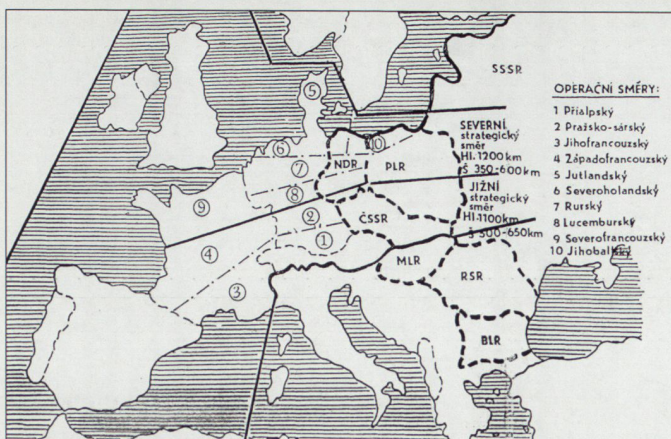
Einteilung der möglichen Kriegsschauplätze in Europa.