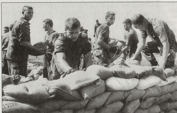
Bisher grösster Katastropheneinsatz in der Geschichte der deutschen Bundeswehr.

Dimension dar. Die Elbe, mit 1165 Kilometer Länge einer der grössten Ströme Mitteleuropas, ist bis Magdeburg zirka 150 Meter breit. Der Strom legte sich über 800 Meter breit über Dresden. In Tangermünde hatte er eine Breite von zirka 4000 Metern angenommen. Zum Transport von Sandsäcken und Hilfsgütern sowie zur Beobachtung der Flutentwicklung wurden über 60 Hubschrauber eingesetzt. Am «Bösen Ort» haben die Soldaten beispielsweise die Deiche mit 450 000 Sandsäcken verstärkt. Tornados der Luftwaffe flogen täglich Aufklärungseinsätze über die Hochwassergebiete. Es entstanden über 1000 Fotos, die von den Fachleuten der Bundesanstalt für Wasserwirtschaft ausgewertet wurden. Mit ihren Wärmebildkameras spürten sie Lecks in den Deichen auf. Schweres Pioniergerät, Bergepanzer, Motor-