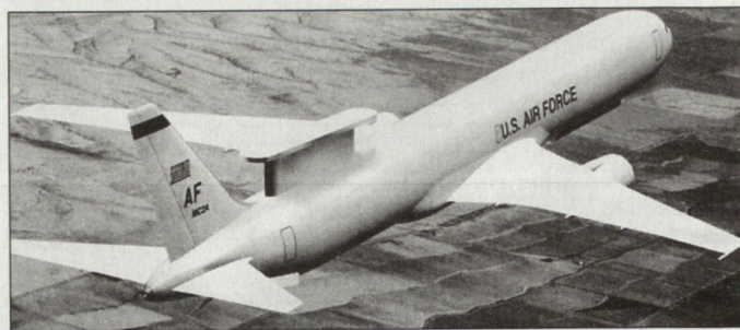
Skizze des geplanten neuen Überwachungsflugzeuges MC 2 A.

Ende Oktober 2002 sollen sich bereits rund 4000 US-Soldaten in Qatar aufgehalten haben; nach Vollbezug der Stützpunkte wird mit einer Stationierung von gegen