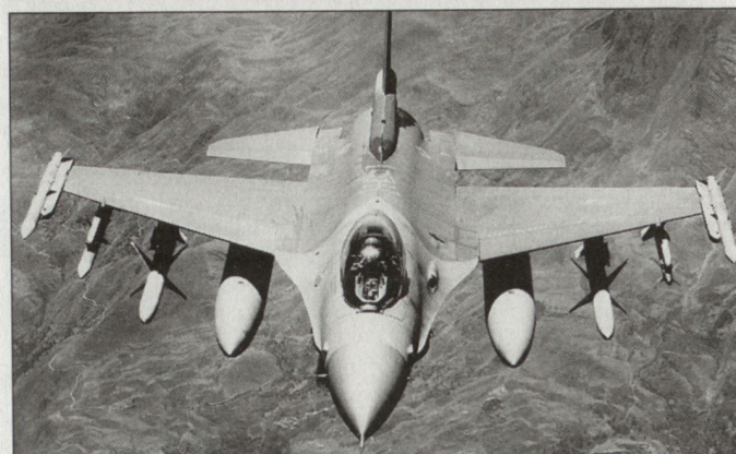
US-Luftstreitkräfte in der Golfregion (Bild Kampfflugzeug F-16) werden künftig vermehrt vom Stützpunkt El Udeid (Qatar) aus operieren.

Die Ausbildung erfahren die polnischen Panzerbesatzungen beim deutschen Panzerbataillon 64 in Wolfhagen. Die 10. polnische Brigade ist ab Herbst 2002 in den Übungszyklus der deutschen 7. Division einbezogen. Bereits im vergangenen November hat im Rahmen einer ARRC-Übung ein erster Einsatztest stattgefunden. hg