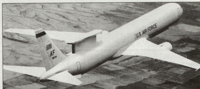
Skizze des geplanten neuen Überwachungsflugzeuges MC 2 A.

Seit Frühjahr 2002 sind die US-Streitkräfte daran, in der Wüste von Qatar einen neuen Luftwaffenstützpunkt sowie die Infrastruktur für gewisse Führungseinrichtungen aufzubauen. Die laufenden Investitionen, die sich vor allem auf den neuen Luftstützpunkt El Udeid konzentrieren, sollen gemäss US-Verteidigungsministerium mehr als 1,5 Mia. US-$ betragen. Die Stützpunkte im Emirat Qatar dürften bei einer künftigen Militäroperation gegen den Irak eine zentrale Rolle sowohl als Basis für Luftangriffe als auch für Logistik und Führung bilden. Die neue Air Base verfügt über eine Startbahn von 4,5 km