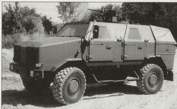
Das neue Allschutz-Transportfahrzeug (ATF) «Dingo» steht heute auf dem Balkan und in Afghanistan im Einsatz.

Was für den Kampfpanzer «Leopard 2» bisher ein Wunsch blieb, wird jetzt für das Allschutz-Transportfahrzeug Dingo realisiert: Die ersten Fahrzeuge werden mit einem Führungs-Informa-