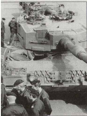
Ausbildung polnischer Panzersoldaten am Kampfpanzer «Leopard 2A4.

Corps) im alliierten Kommandobereich Europa befindet sich in Düsseldorf. Insgesamt wird die Bundeswehr nebst anderem Mate-