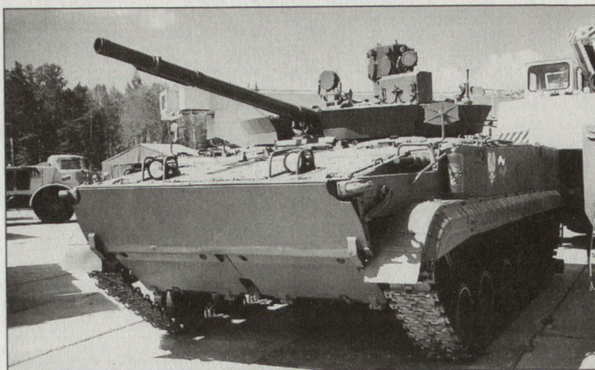
Schutzsystem «Arena 2» auf einem Kampfschützenpanzer BMP-3; erkennbar sind der Kassettenkragen am Turm und die Sensorik zuoberst in der Turmmitte.

nen vorgenommenen Verbesserungen ist nicht bekannt. Jedoch ist davon auszugehen, dass die Wirksamkeit des Systems gesteigert wurde – z. B. durch Optimierung der Splitterkassette und der Ausstossladung, durch Einsatz eines leistungsfähigeren Rechners