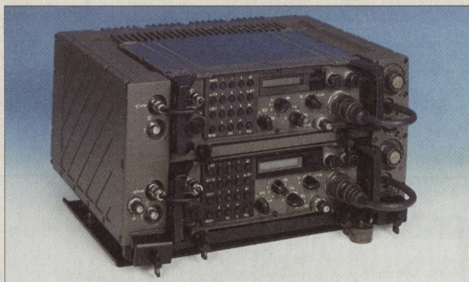
Taktisches Funkgerät SE-235.

Der Bundesrat unterbreitet in einer Zusatzbotschaft zum Rüstungsprogramm 2002 den Räten 37 Millionen für Ausbil-dungsmittel zum neuen Schützenpanzer 2000. Im kommenden Herbst werden die ersten der mit dem Rüstungsprogramm 2000 bewilligten 186 Schützenpanzer des schwedischen Typs CV 9030 ausgeliefert. Zu Ausbildungszwecken müssen noch drei Chassis- und sieben Turmtrainer beschafft werden. Die beantragte Investition von 37 Millionen wird gleichzeitig im Rüstungs-programm 2000 gekürzt und erhöht den Verpflichtungskredit insgesamt nicht. ■