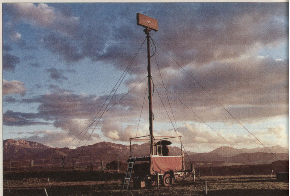
Alarmierungssystem Stinger mit Mast.

Im Jahre 2001 betrug der Gesamtwert des exportierten Kriegsmaterials 258,2 Millionen Franken (2000: 213,6 Mio.). Dies entspricht einem Anteil von 0,19% (2000: 0,16%) der gesamten Warenausfuhr der Schweizer Wirtschaft. Die hauptsächlichsten Abnehmerländer waren Deutschland (46,9 Mio.), Irland (38 Mio.), Spanien (30,4 Mio.), die USA (21,7 Mio.) und Grossbritannien (14,7 Mio.). www.seco-admin.ch dk