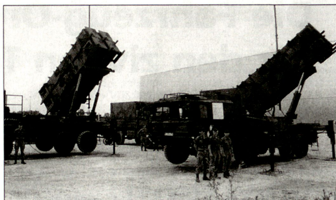
Gemäss Planung sollen die Flab-Lenkwassensysteme «Patriot» der Luftwaffe in den nächsten Jahren modernisiert werden.

■ Das neue Kommando Operative Führung Luftstreitkräfte wird als eigenständiger Kernstab aufgestellt, der nach Personalergänzung die Einsatzplanung/-führung von Luftstreitkräfteeinsätzen auf der taktisch-operativen Ebene übernehmen kann.