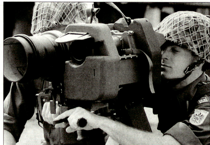
Österreichische Teilnahme bei der gemeinsamen europäischen Eingreiftruppe (Bild: Soldaten des Bundesheeres mit PAL 2000).