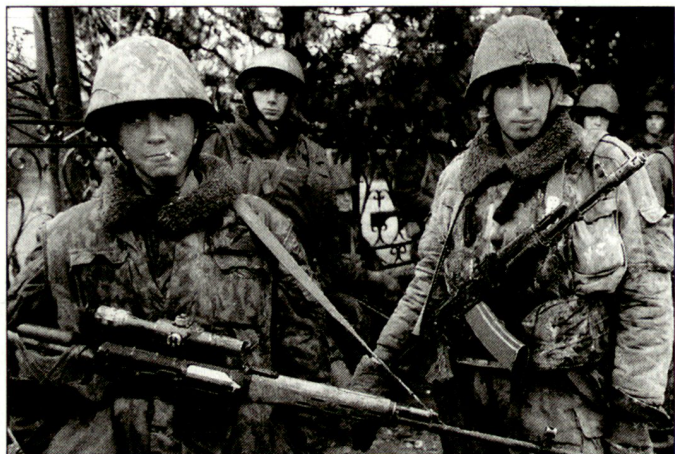
Keine Budgeterhöhung für die russischen Streitkräfte; vermutlich können auch die geplanten Gehaltsanpassungen der Soldaten in Tschetschenien (Bild) nicht vorgenommen werden.