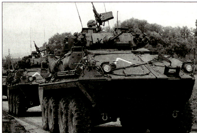
Radschützenpanzer der Version LAV III werden bereits bei den kanadischen Streitkräften genutzt.