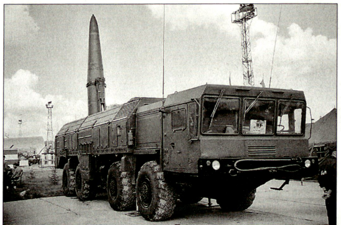
Gefechtsfeld-Lenkstoffwaffensystem SS-26 «Iskander-E».

Rüstungsausstellung «Ural Arms Expo 2000» der Öffentlichkeit gezeigt. Zusammen mit dieser Version werden Splitter-/Spreng-, Penetrations- und Kassettengefechtswaffen angeboten. Das Gefechtskopfgewicht beträgt für die konventionelle Version rund 480 kg. Die Zielgenauigkeit (CEP) soll gemäss Herstellerangaben rund 100 m betragen, für die russische Version dürfte diese wesentlich verbessert sein. Im Einsatz verfügt der mobile Abschusskomplex «Iskander» über fünf weitere schwere Geländefahrzeuge (8x8); darunter befinden sich Raketenmahlade-, Kommando- und Übermittlungssowie Logistikfahrzeuge. Gemäss russischen Presseberichten wurde im Herbst 2000 für die Bedürfnisse der eigenen Streitkräfte eine