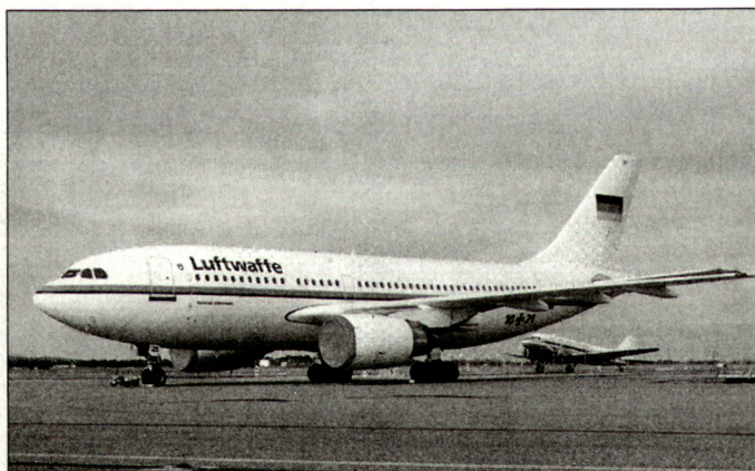
Transportflugzeug «Airbus» A-310 der deutschen Luftwaffe.

tung der vier A-310 wird deren Rolle als so genannte MRTT (Multi Role Transport Tanker) ermöglicht. Diese hochpriorisierte Kernfähigkeit zur Luftbetankung kann auf diese Weise mit vertretbarem finanziellen Aufwand ermöglicht werden. Die Realisierung dieses Vorhabens schafft eine erste Fähigkeit für die deutsche Luftwaffe zur Luft-Luft-Betankung, die auch für die laufenden Einsätze der Kampfflugzeuge «Tornado» auf dem Balkan rasch genutzt werden kann. Mit der Umsetzung dieses Vorhabens wird der in der «Defence Capabilities Initiative» definierten NATO-Forderung Rechnung getragen. Auch im Rahmen der geplanten europäischen Krisenreaktionskräfte ist die fehlende Luftbetankungskapazität in Europa als ein wesentliches Defizit festgestellt worden. hg