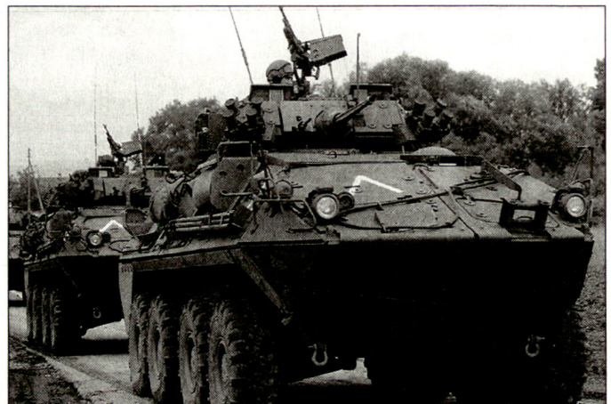
Radschützenpanzer der Version LAV III werden bereits bei den kanadischen Streitkräften genutzt.