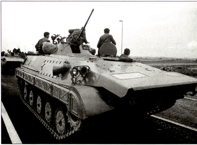
Jugoslawischer Schützenpanzer BVP M-80.

Armee als stark geschwächt. Doch die NATO musste ihre erste Erfolgsbilanz später laufend nach unten korrigieren. Durch die Luftangriffe wurden weit weniger terrestrische Mittel zerstört als anfänglich angenommen. Lediglich die Mittel der Luftverteidigung wurden stark dezimiert. Hingegen war es nicht gelungen, das Gros der jugoslawischen Landarmee entscheidend zu schwächen. Der bescheidene Erfolg der NATO-Luftangriffe ist sicher zu einem Teil auf eine geschickte Tarnung und Täuschung der VJ zurückzuführen.