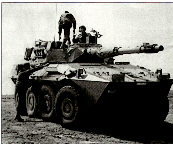
Spanien will eine moderne Berufsarmee aufbauen; Bild: erste Zuführung italienischer Schützenpanzer «Centauro».

terhalten. Der Aufbau der Berufsarmee ist anfänglich gut angelaufen, stiess dann aber zunehmend auf Schwierigkeiten. Ursprünglich bewarben sich meist mehrere Kandidaten für jede ausgeschriebene Funktion. In letzter Zeit soll aber das Interesse stark nachgelassen haben; als Hauptgrund gilt der niedere Anfangslohn von umgerechnet knapp SFr. 1000.- pro Monat. Damit dennoch die geplanten Bestandeszahlen erreicht werden können, hofft man auf eine vermehrte Anstellung von Frauen; bereits heute sollen rund 25% der Bewerber Frauen sein. Zudem sind die anfänglich definierten hohen Anforderungen für gewisse Funktionen nach unten angepasst worden, was allerdings negative Auswirkungen auf die Leistungsfähigkeit der Truppen haben könnte. hg