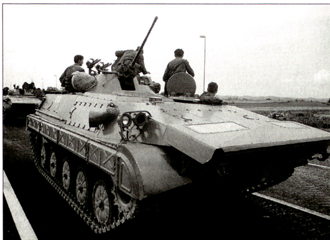
Jugoslawischer Schützenpanzer BVP M-80.

Armee als stark geschwächt. Doch die NATO musste ihre erste Erfolgsbilanz später laufend nach unten korrigieren. Durch die Luftangriffe wurden weit weniger terrestrische Mittel zerstört als anfänglich angenommen. Lediglich die Mittel der Luftverteidigung wurden stark dezimiert. Hingegen war es nicht gelungen, das Gros der jugoslawischen Landarmee entscheidend zu schwächen. Der bescheidene Erfolg der NATO-Luftangriffe ist sicher zu einem Teil auf eine geschickte Tarnung und Täuschung der VJ zurückzuführen.