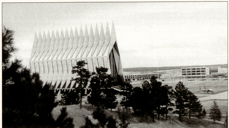
Im Vordergrund die «Cadet Chapel», hinten ein Teil des Campus der USAFA.

Zu diesem Zweck werden am ersten und zweiten Tag des Symposiums themenbezogene Vorträge und Expertendiskussionen abgehalten. Es wird dabei versucht, das Thema aus möglichst unterschiedlichen Perspektiven zu durchleuchten: So finden sich unter den Sprecherinnen und Sprechern sowohl erfahrene Generäle als auch junge Hauptleute aus dem militärischen Bereich, Professoren verschiedener Universitäten aus Psychologie, Religion, Kunst und Literatur, weltbekannte Sportlerinnen und Sportler, aber auch die diesjährige Miss Amerika war eingeladen: Sie hat sich als Lehrerin und Sportdirektorin an der «Family Catholic Academy» zum Ziel gesetzt, die Bevölkerung für die Bedeutung moralischer Aspekte im Unterricht zu sensibilisieren. Die Studierenden sollen dabei einerseits die Möglichkeit erhalten, von diesen Persönlichkeiten aus erster Hand