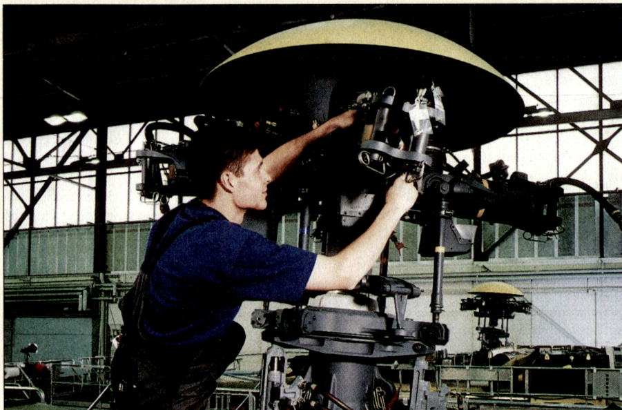
Die Montagelinie für die Endmontage der neuen Serie Transporthelikopter ist voll in Funktion. Der Auftrag wird 2002 abgeschlossen.

Das Zusammengehen von Firmen erfordert in vielen Fällen, dass aus betriebswirtschaftlicher Sicht Doppelspurigkeiten in Forschung und Entwicklung, in Produktion und Service aufgegeben werden. Deshalb ist der Restrukturierungsprozess mit einem schmerzlichen Abbau von Arbeitsplätzen verbunden. In Deutschland setzte es seit 1989 beispielsweise einen dramatischen Kapazitätsabbau von rund 280 000 auf zirka 90 000 Stellen ab. In der Schweiz mussten Ende der Neunzigerjahre allein im Bereich des Armeematerialunterhalts im VBS über 3000 Stellen gestrichen werden.