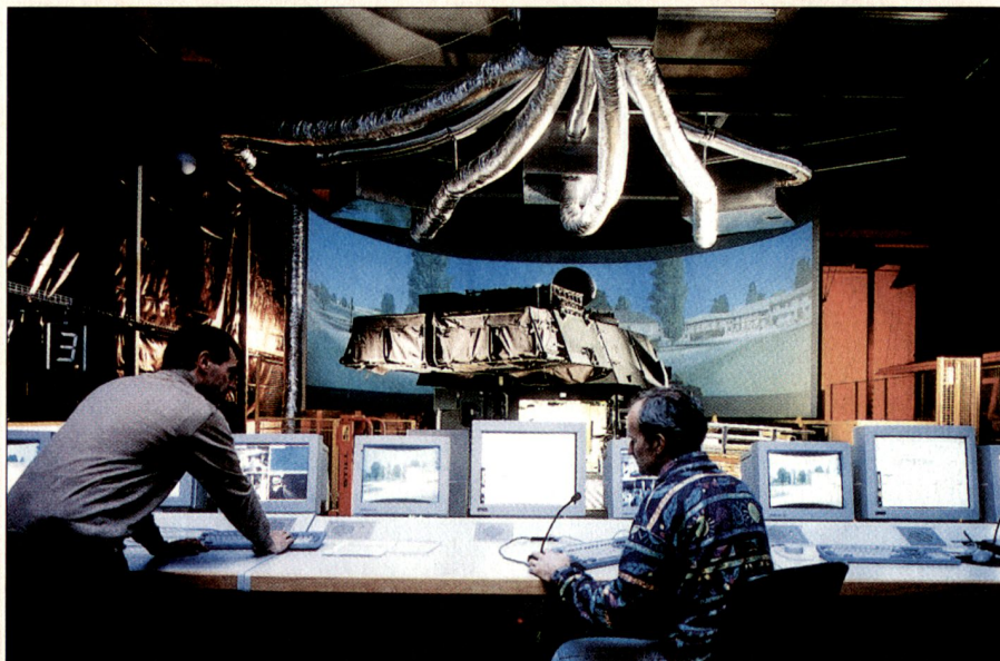
Die modernisierte Schiessausbildungsanlage für Panzerhaubitzen M109 hat die Truppenprobung erfolgreich bestanden.

Die Schweizer Industrie, die im Alleingang seit vielen Jahren keine Grosssysteme mehr entwickeln und fertigen kann, muss sich als Zulieferer und Systembetreuer profilieren. Bedeutungsvoll ist allerdings ein frühes Engagement bei internationalen Schlüsselprojekten, die im Verbund reali-