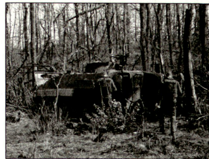
Zerstörter jugoslawischer Schützenpanzer.

Das nächste gemeldete Objekt war ein abgeschossener jugoslawischer Schützenpanzer. Dieser sollte durch deutsche AC-Spezialisten auf DU-Munitionsspuren (abgereichertes Uran) untersucht werden. Zunächst musste aber der Weg zum Wrack vom AUCON-Team auf Minen abgesucht werden. Zwei Stunden später erschienen zwei deutsche Schützen-