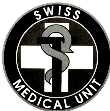
Logo der Swiss Medical Unit SMU.

In den 80er-Jahren versucht die UNO vergeblich einen Frieden in der Westsahara herbeizuführen; er scheitert am Widerstand Marokkos. Erst 1991