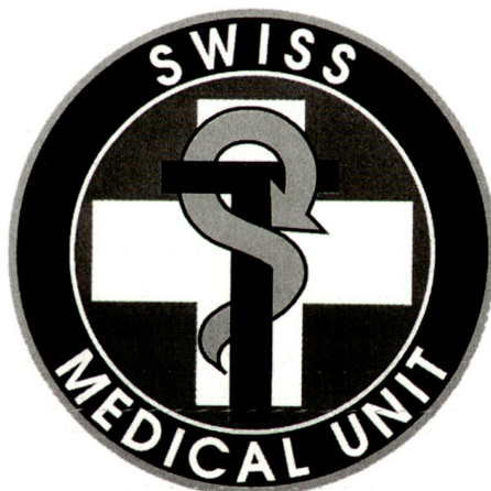
Logo der Swiss Medical Unit SMU.

In den 80er-Jahren versucht die UNO vergeblich einen Frieden in der Westsahara herbeizuführen; er scheitert am Widerstand Marokkos. Erst 1991