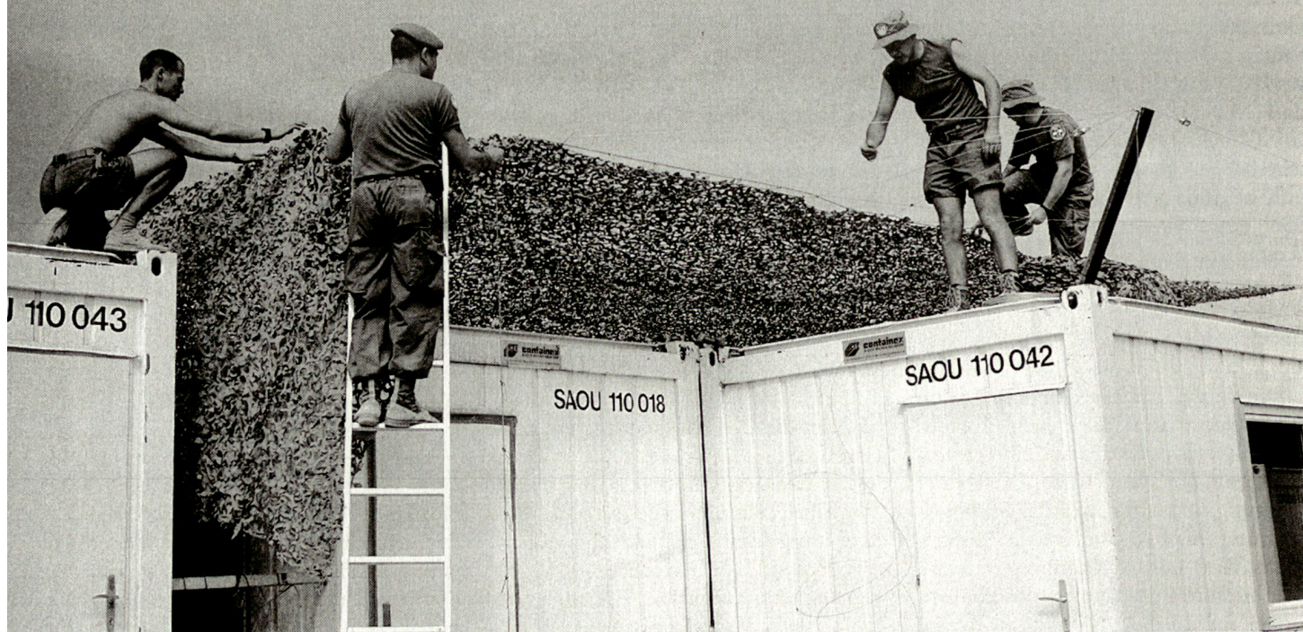
Campaufbau in Smara.

■ Die beiden Nebenkliniken befinden sich in Smara und Dakhla und zählen je 14 Personen. Die SMU zählt von 1991 bis März 1992 total 82 Personen, vom März bis Dezember 1992 sind es 64 Personen und ab Januar 1993 bis zum Ende der Mission im Juni 1994 noch 45–50 Personen. Das Personal der SMU setzt sich zusammen aus 60% im Sanitätsbereich und 40% im Logistikbereich, davon je 20% im Kommissariatsdienst und Material-/Transportdienst. Gesamthaft haben 292 (nach anderen Angaben 302) Personen in der SMU Dienst geleistet. Ausbildungsmässig sind 60–70% Angehörige der Armee (AdA) und 30–40% Zivile. Nach Geschlecht beträgt der Anteil der Männer und Frauen je 50%. Die Einsatzdauer variiert stark und umfasst die Zeit von drei Wochen (Wiederholungskurs) bis über einem Jahr. Der Sanitätsdienst der MINURSO ist in zwei Stufen organisiert: