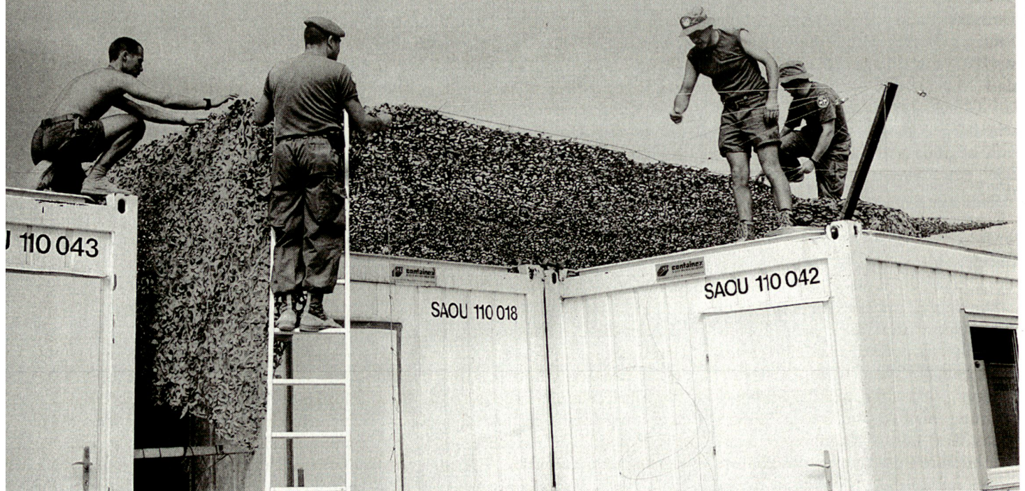
Campaufbau in Smara.

■ Die beiden Nebenkliniken befinden sich in Smara und Dakhla und zählen je 14 Personen. Die SMU zählt von 1991 bis März 1992 total 82 Personen, vom März bis Dezember 1992 sind es 64 Personen und ab Januar 1993 bis zum Ende der Mission im Juni 1994 noch 45–50 Personen. Das Personal der SMU setzt sich zusammen aus 60% im Sanitätsbereich und 40% im Logistikbereich, davon je 20% im Kommissariatsdienst und Material-/Transportdienst. Gesamthaft haben 292 (nach anderen Angaben 302) Personen in der SMU Dienst geleistet. Ausbildungsmässig sind 60–70% Angehörige der Armee (AdA) und 30–40% Zivile. Nach Geschlecht beträgt der Anteil der Männer und Frauen je 50%. Die Einsatzdauer variiert stark und umfasst die Zeit von drei Wochen (Wiederholungskurs) bis über einem Jahr. Der Sanitätsdienst der MINURSO ist in zwei Stufen organisiert: