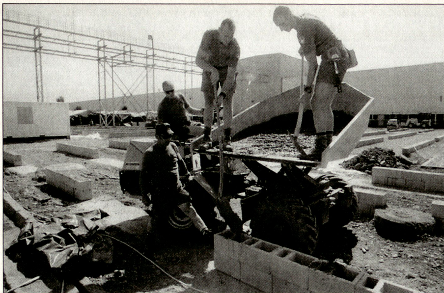
Baufachleute des Festungswachtkorps und andere Armeeangehörige betonieren die Fundamente für das SWISSCOY-Camp.

dafür notwendigen Eigenständigkeit gefestigt. Diese Art der Kooperation muss vermehrt in den strategischen Zielformulierungen der KMU erscheinen.