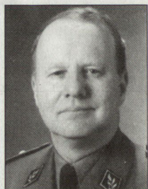
Brigadier Alain Rickenbacher

Unter Berücksichtigung der aufgelaufenen Teuerung resultiert hingegen bei den Ausgaben für die Landesverteidigung ein Wertverlust von 27 Prozent .