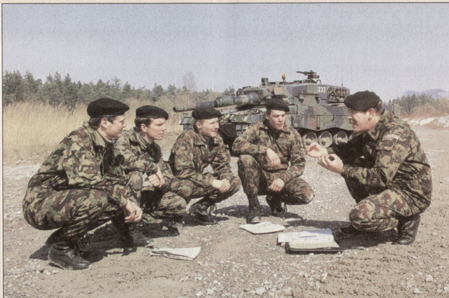
Die Milizkader sollen in der verlängerten RS vermehrt in der Verbandsausbildung geschult werden.

■ Fachlehrer (zirka 150): sind zivile Ausbilder, die Angehörige der Armee in bestimmten Fachgebieten unterrichten.