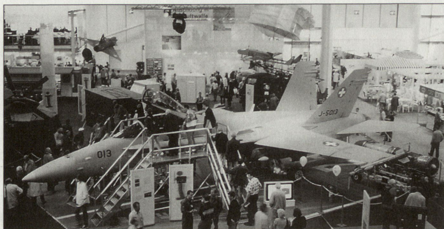
Die F/A-18 als «Publikumsmagnet».