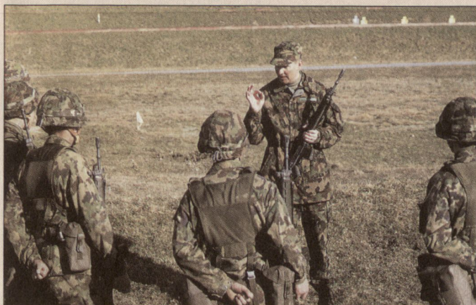
Vermittlung der Grundausbildung soweit wie möglich durch Berufskader.

■ Zeitsoldaten (zirka 1500): Offiziere, Unteroffiziere und Soldaten, die eine vollamtliche Dienstverpflichtung eingehen, aber nur für einige Jahre angestellt werden. Sie sind vor allem als Ausbilder tätig, können aber auch in (subsidiären) Existenzsicherungseinsätzen und/oder in Auslandseinsätzen tätig sein.