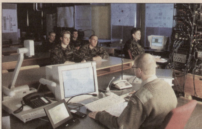
Der Gesamtbestand des Berufspersonals soll 8000 nicht übersteigen.