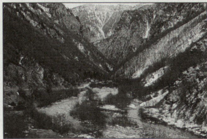
Die Schlucht (Rugovska klisura).

Die Schlucht, 22 km lang, steigt steil an. Die Strasse ist in einem äusserst schlechten