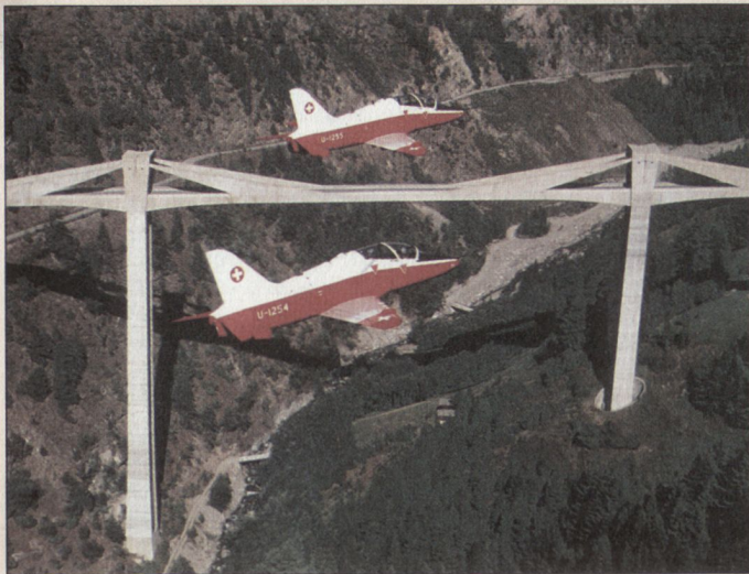
Die Jet-Pilotenanwärter absolvieren ihre Ausbildung auf dem Hawk Mk66 in verschiedenen Modulen. Im Bild eine Patrouille beim «Verbandsflug im Gebirge» bei der Ganterbrücke am Simplon.