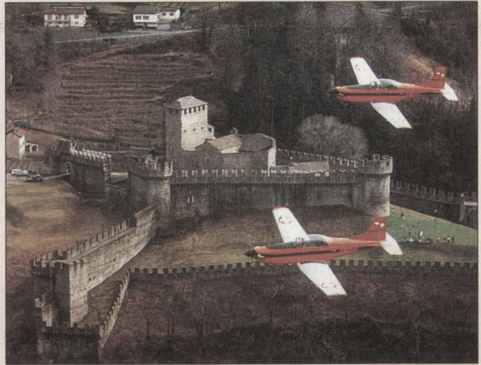
Die Grundausbildung erhalten die Pilotenanwärter auf dem Schulflugzeug Pilatus PC-7. Im Bild eine Patrouille vor dem Castello Montebello in Bellinzona.

Die Jet PA absolvieren ihre Ausbildung auf dem British Aerospace Hawk Mk 66. Auch hier leistet ein moderner Simulator hervorragende Dienste. Das Flugzeug wird für die Waffeneinsatzausbildung mit einem Kanonenpod ausgerüstet. Auch Lenk Waffen des Typs Sidewinder können mitgeführt werden.