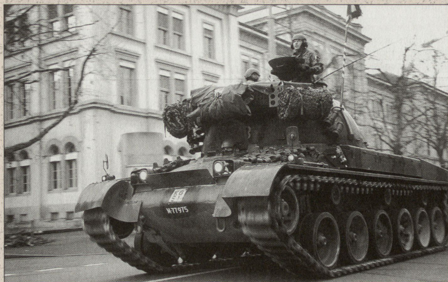
Würdiger Schlussakt: Das Pz Bat 4 defiliert zur Standartenabgabe durch Aarau.

Mit der beschriebenen Fusion, respektive Überführung stehen die Möglichkeiten einer nahtlosen Integration in eine künftige Organisation der Mechanisierten Truppen offen und Strukturen können ohne das Schaffen von Präjudizien im Rahmen der Armee XXI offen gehalten werden. ■