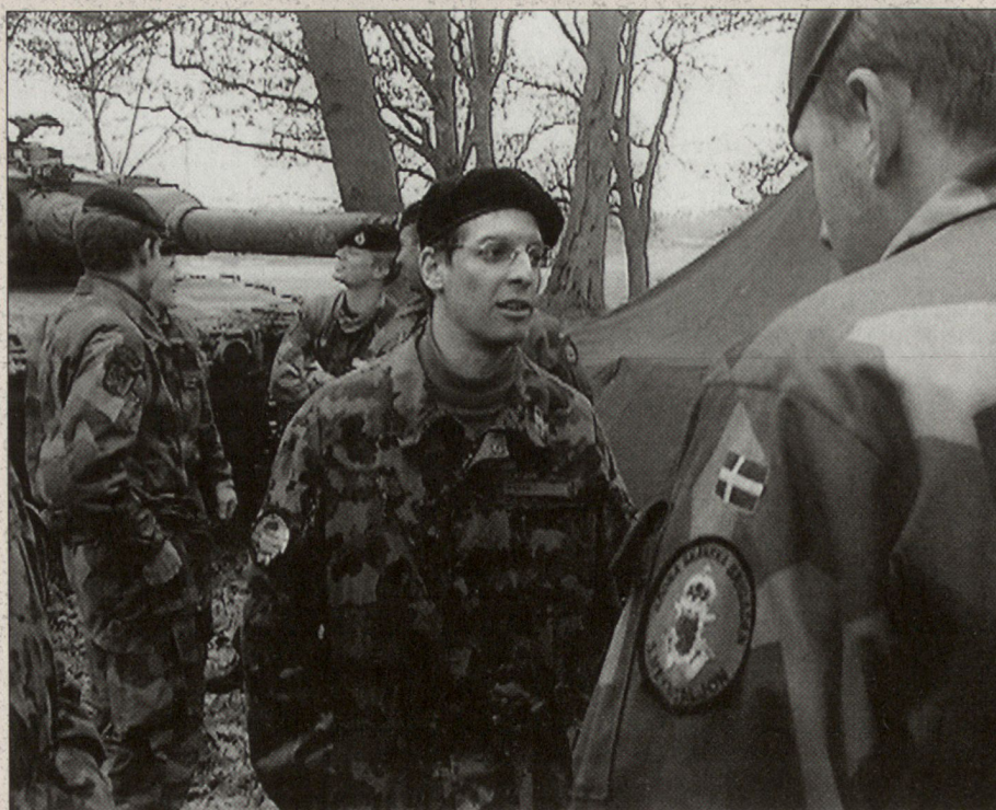
Schwedisch-schweizerische «Fachgespräche» unter Panzerleuten auf dem Waffenplatz Revingehed.

Der Pz Mann muss im Pz leben, kämpfen und überleben. Der Kp Kdt ist \frac{1}{10} der Kampfkraft seiner Kp und muss den Kampf aktiv, meist von vorne führen und so nachhaltig beeinflussen.