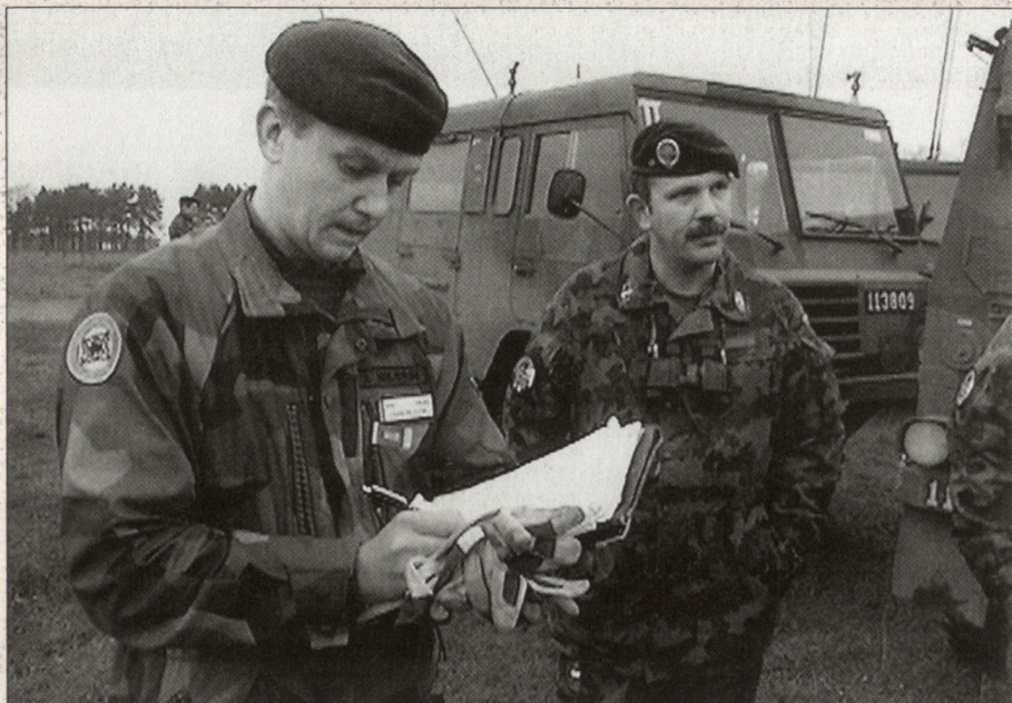
Zwischenbesprechung der internationalen Übungsleitung vor der nächsten «Angriffsphase».