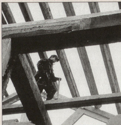
SWISSCOY: Wiederaufbau des Schulhauses Donaj.

Des weiteren gehören zum Schweizer Team Mediziner, Übermittlungsfachleute, Küchenpersonal und Mechaniker. Das gesamte Schweizer Kontingent zählt 133 Armeeangehörige. Zu den CIMIC-Projekten gehören der Wiederaufbau der Schulhäuser Donaj und Laniste sowie die Wasserfassung für das Schulhaus in Banja. Dabei wird eine hervorragende Arbeit geleistet. Für den Beobachter bleibt ein Wermutstropfen: während die Schweizer Soldaten den Dachstuhl für das Schulhaus Donaj errichten und ein Detachement Ex-UCK-