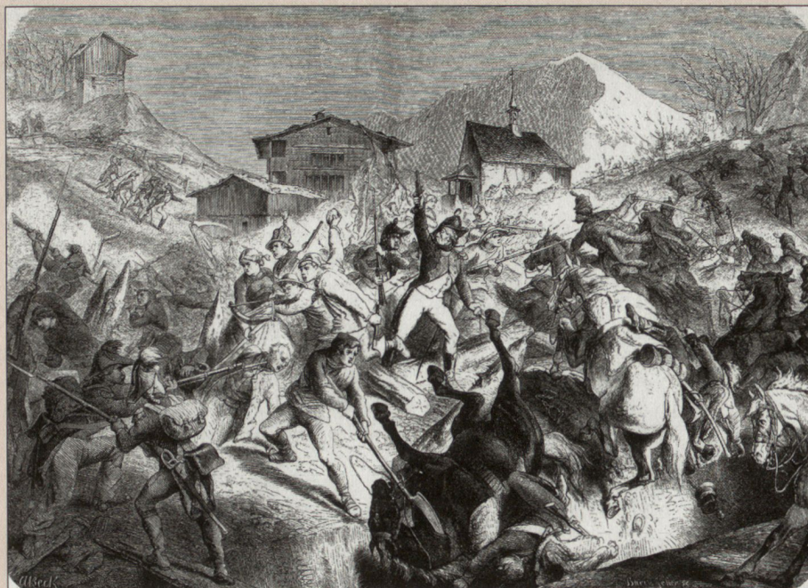
Der Kampf der Unterwaldner am Allweg am 9. September 1799 – weitgehendes Fehlen des Kompetenztransfers aus den Fremden Diensten.