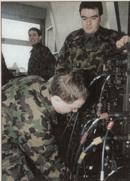
Dank IMFS kann über beliebige Endgeräte z. B. vom Kampfpanzer aus direkt mit dem Kommandoposten eines grossen Verbandes kommuniziert werden.

Auch wenn beispielsweise die Führung der einzelnen IMFS-Standorte (Zugs-