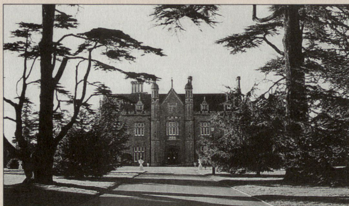
Beckett House Library.

Seit dem Ende des Kalten Krieges sind die Verteidigungsausgaben in den meisten Ländern gesunken. Rüstungsbudgets müssen sorgfältig optimiert werden. In diesem veränderten Umfeld ist es für den Staat und die Rüstungsindustrie von entscheidender Bedeutung, Projekte effizient auszuführen. Dies erfordert ein umfassendes Verständnis von zivilen und staatlichen Organisationen. Das MDA bietet dem Teilnehmer eine mo-